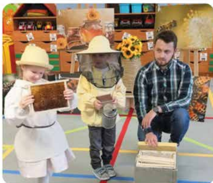
„Ratujemy pszczoły”- niezapomniana lekcja pszczelarstwa z żywymi pszczołami.

W naszym przedszkolu realizowana jest innowacja logopedyczna pt. „La, lo, lu razem z mamą i tatą”. Zajęcia prowadzone są przez Panią logopedę, która również zachęca rodziców do wspólnej zabawy z dzieckiem.