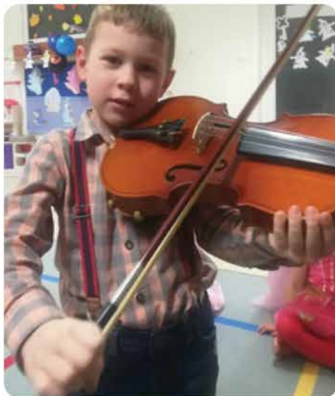
Pokaz instrumentów w naszym przedszkolu.