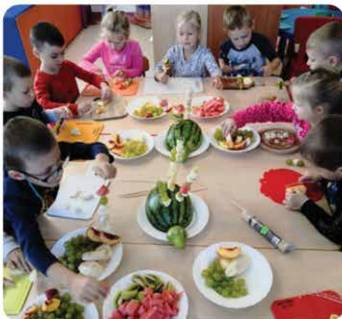
„Pyszny i zdrowy owocowy jeź”

W ramach realizacji programu Przedszkole Promujące Zdrowie poprzez zajęcia kulinarne oraz organizowanie konkursów kulinarnych, staramy się wyrabiać u dzieci nawyk zdrowego odżywiania, zachęcamy również do tego rodziców, którzy chętnie biorą w nich udział.