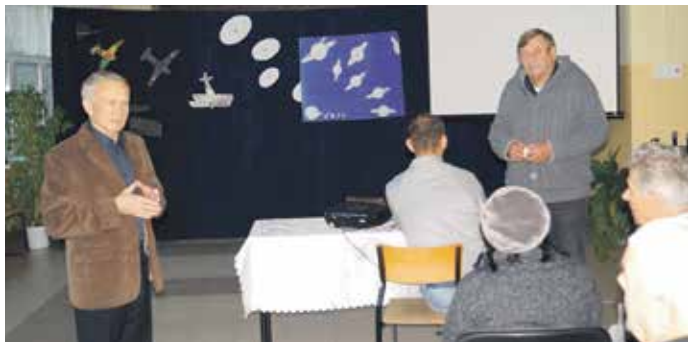
Szkoła Podstawowa w Redzikowie gości wielu wartościowych ludzi. Współpracuje między innymi ze Stowarzyszeniem Przyjaciół 28 SPLM, które zaprosiło na spotkanie z mieszkańcami gminy naszego jedyne go kosmonautę Mirosława Hermaszewskiego.

Słupsku. Wynikiem tego jest nie tylko nadanie naszej szkole imienia Pułku.