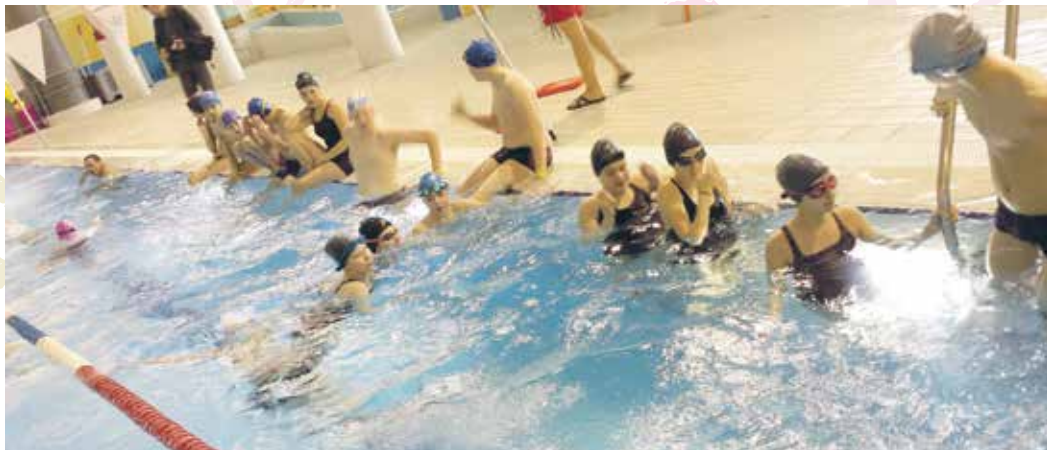
W akwaparku, który jest tuż przy szkole dzieci regularnie uczestniczą w zajęciach nauki pływania. W szkole funkcjonują klasy pływackie, a starsze klasy mogą zdobywać uprawnienia ratownika wodnego.

nej i profilaktyki organizujemy cykliczne imprezy - „Nie truj się, nie bądź toksyczny”, „Trzymaj formę” oraz zajęcia z gośćmi, na przykład panią dietetyk. W ubiegłym roku uczniowie przygotowali przedstawienie profilaktyczne „Śnieżka”.