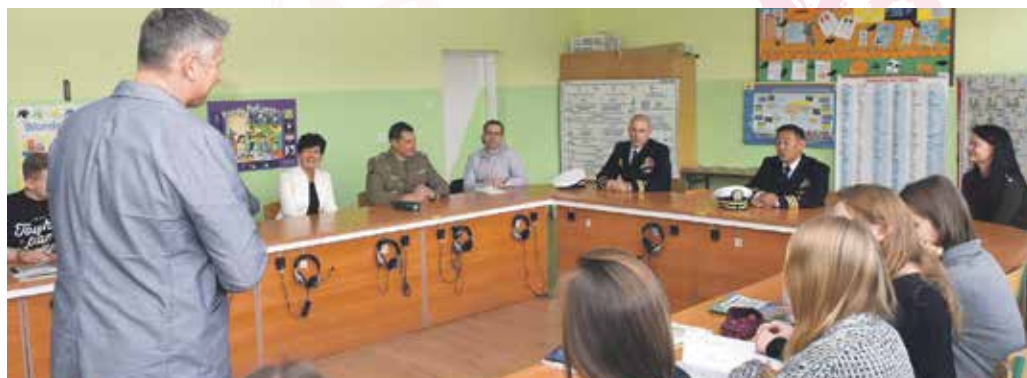
Pracownia językowa. Od lutego wspólnie z uczniami Szkoły Podstawowej w Redzikowie uczą się żołnierze armii amerykańskiej. Oni poznają język polski, a my angielski.

„Tajemnicą sukcesu jest zacząć”. (Mark Twain). Pokonywanie granic i rozwijanie przyjaźni pomiędzy dwoma