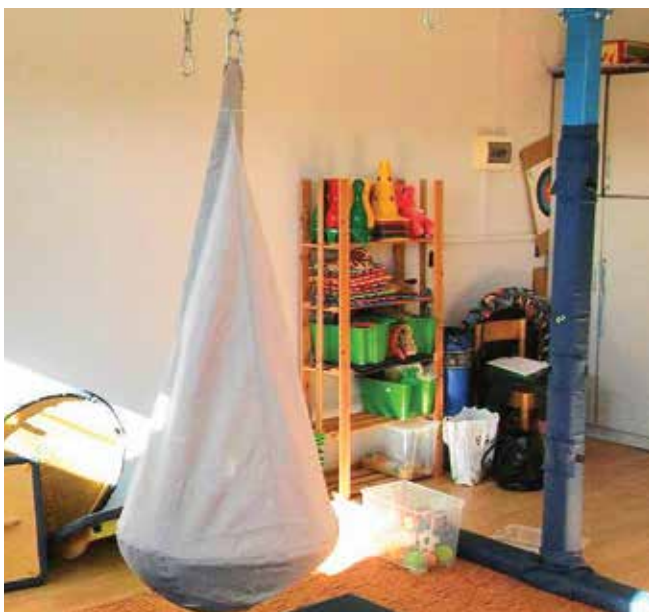
Sala integracji sensorycznej