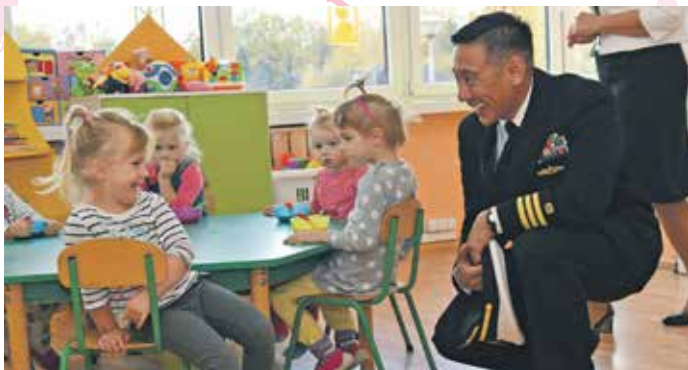
Dowódca Navy Support Facility Rafael Miranda regularnie odwiedza uczniów w ramach współpracy polsko-amerykańskiej.

W ramach integracji z lokalnym środowiskiem nawiązaliśmy ciekawą i owocną współpracę ze Stowarzyszeniem Przyjaciół 28 Słupskiego Pułku Lotnictwa Myśliwskiego w