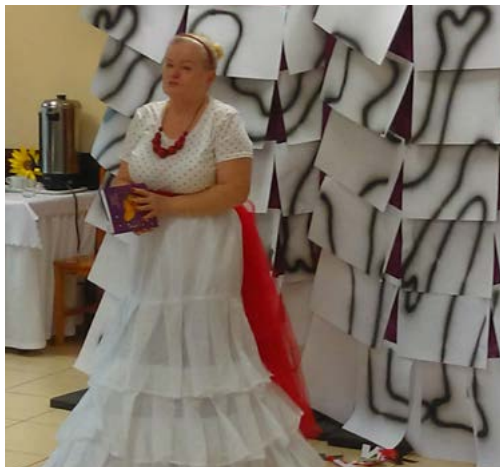
Dzień Seniora w Lubuczewie