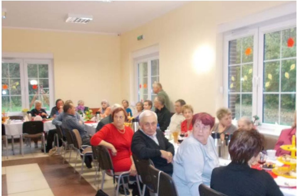
Dzień Seniora w Gałęzinowie

Zabawa odbyła się w Hali Sportowo - Wido-wiskowej w Jezierzycach. Organizatorem balu był Gminny Ośrodek Pomocy Społecznej w Słupsku, który zadbał o kawę, herbatę i pieczywo, natomiast Gminny Ośrodek Kultury w Głobinie zapewnił oprawę muzyczną. Do tańca przygrywał zespół wokalno-instrumentalny MK Dance. Zabawa trwała od 17:00 do 23:00 i zapewniła ogromną dawkę pozytywnej energii, która być może jest sekretem dobrego samopoczucia naszych seniorów.