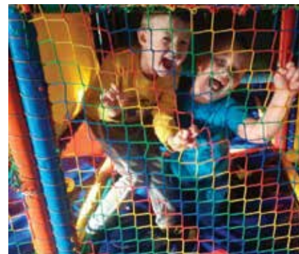
Zabawa w sali zabaw w Słupsku

Uczniowie w ramach zajęć dodatkowych uczą się języka niemieckiego i kaszubskiego. Swoje umiejętności mogli zaprezentować rodzicom, śpiewając kolędy w czterech językach na "Wieczorze kolęd". Zdobywanie wiadomości o kulturze Kaszub jest możliwe również dzięki wycieczkom i lekcjom w terenie.