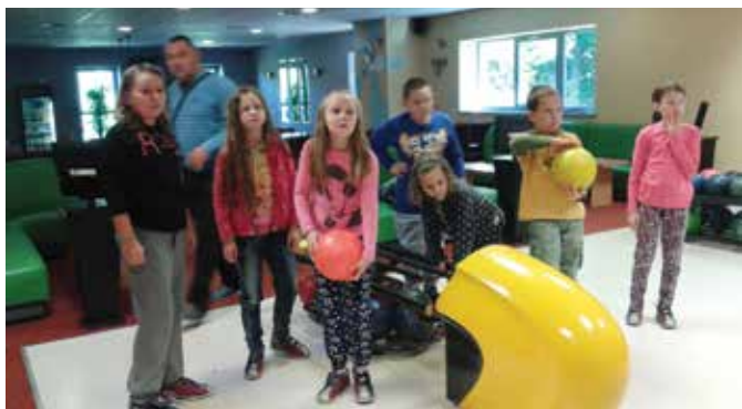
Zabawa w kręgli w Redzikowie - klasa IV