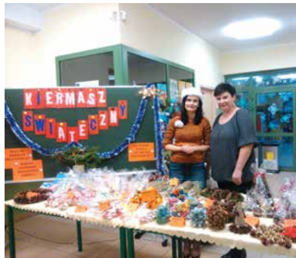
Dbamy o potrzebujących