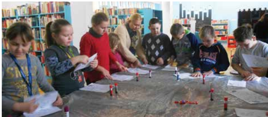
Lekcja w Miejskiej Bibliotece Publicznej w Słupsku

Zapraszamy do odwiedzenia naszej strony internetowej www.spwlynkowko.manifo.com