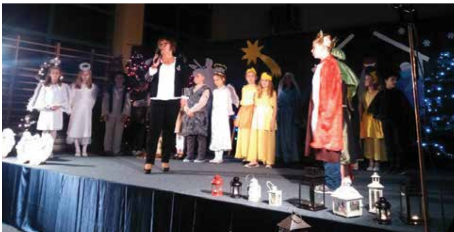
Przedstawienie jasełkowe dla Seniorów w wykonaniu uczniów klasy II

Szkoła jest wyposażona w nowoczesną salę