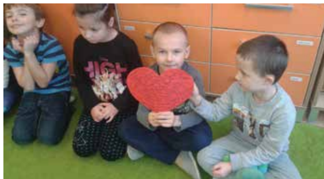
Uczniowie klasy Ia uczą się przez zabawę