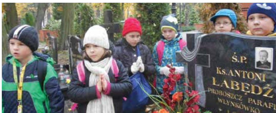
Pamiętamy o bliskich, którzy odeszli