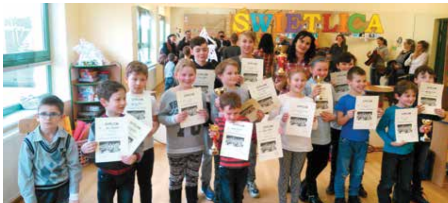
Finał II Rejonowego Turnieju Szachowego organizowanego przez SP Włynkówko