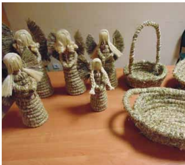
Efekty pracy z sianem są zadziwiające. Wszystkie konstrukcje powstały podczas warsztatów.