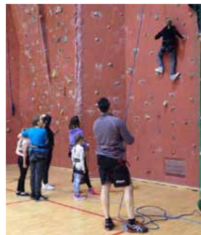
Kolejne zmagania na ścianie odbędą się podczas Zimowego Turnieju Solectw.