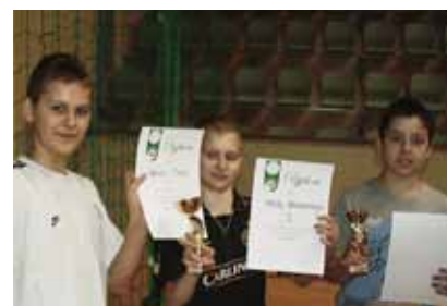
Zwycięzcy zawodów z nagrodami.

Każdy z zawodników otrzymał dyplom i puchar, gratulujemy.