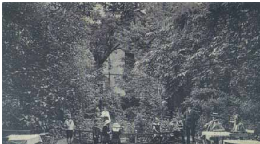
Ogród na tyłach restauracji w młynie w Siemianicach. Pocztówka z 1920 roku.