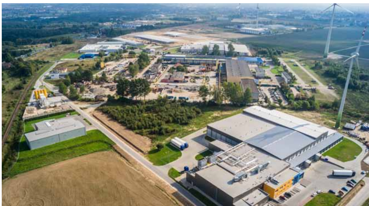
Słupska Specjalna Strefa Ekonomiczna

Pomorska Agencja Rozwoju Regionalnego S.A. Zarządzająca Słupską Specjalną Strefą Ekonomiczną i Słupskim Inkubatorem Technologicznym Tel. +48 59 841 28 92, Fax +48 59 841 32 61, office@parr.słupsk.pl www.sse.słupsk.pl