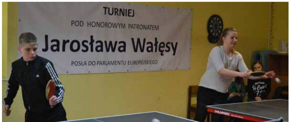
Jednym z honorowych patronów turnieju był Jarosław Wałęsa.