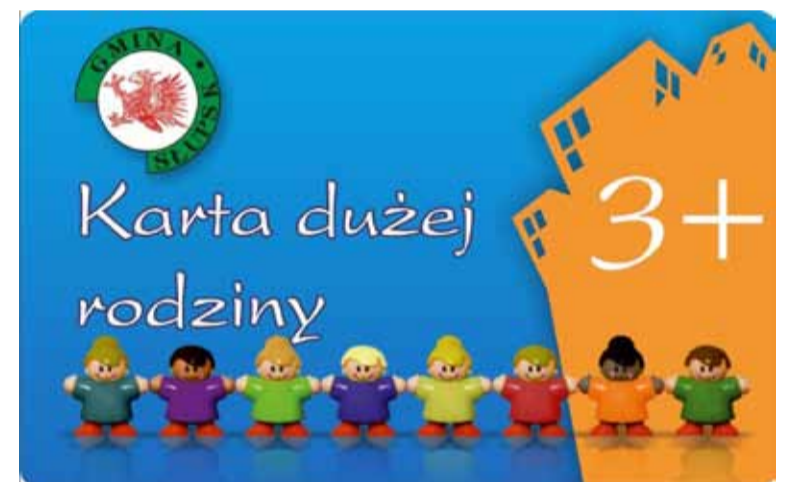
Tę kartę ma posiada już ponad 100 rodzin.

Pod budownictwo indywidualne – Bydlino, Krępa Słupska, Lękwica oraz tereny inwestycyjne dla biznesu