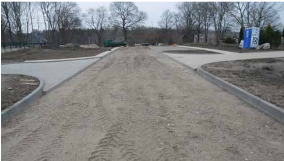
Ta droga w Bruszkowie Wielkim ułatwi dotarcie do boiska, które zostało oddane do użytku w zeszłym roku.