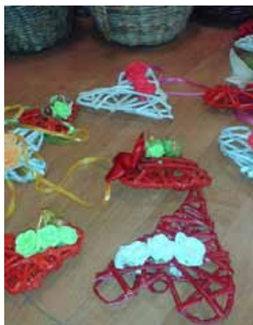
Wiklinowe serca mogą stanowić ciekawy element wystroju mieszkania.