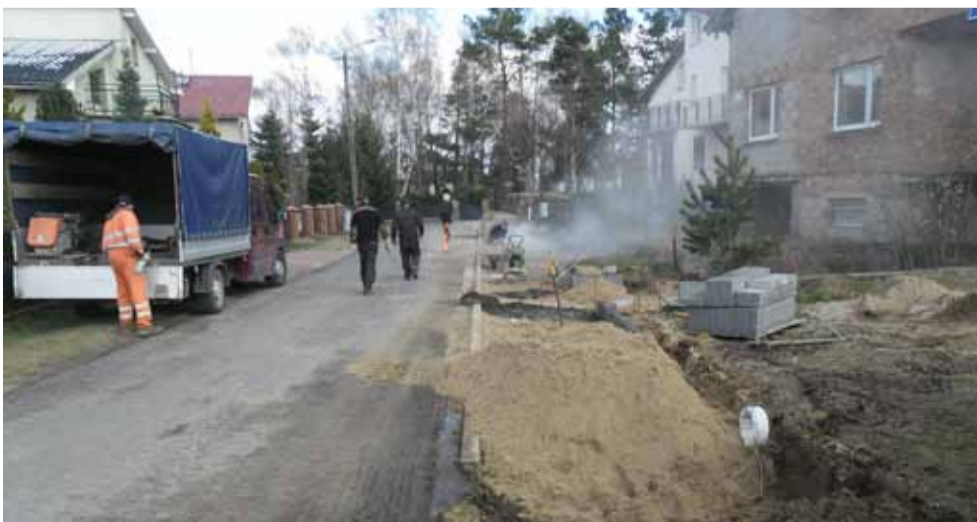
Na ulicy Fiolkowej w Siemianicach powstaje chodnik.