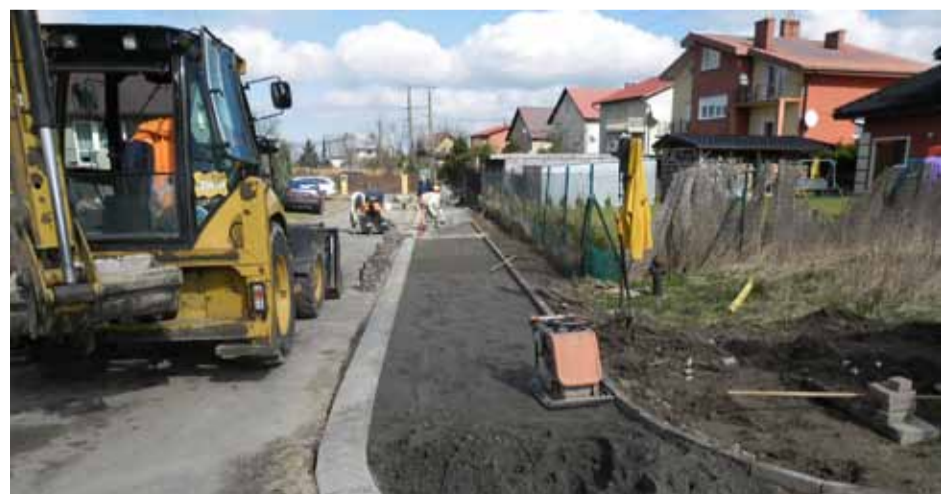
Na ulicy Makowej w Siemianicach także powstaje chodnik.