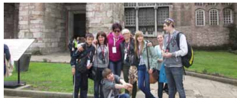
Pamiętkowe zdjęcie z tureckim budownictwem w tle.