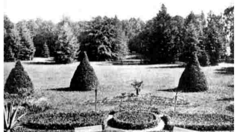
Najstarsi mieszkańcy Jezierzyc pamiętają tak pięknie wyglądający park

świetlica, boiska i plac zabaw zostanie w tym roku wzbogacony o wiatę, ławy i wędzarnię z grillem. Wszystko zakupione zostanie w ramach funduszu sołectwiego.