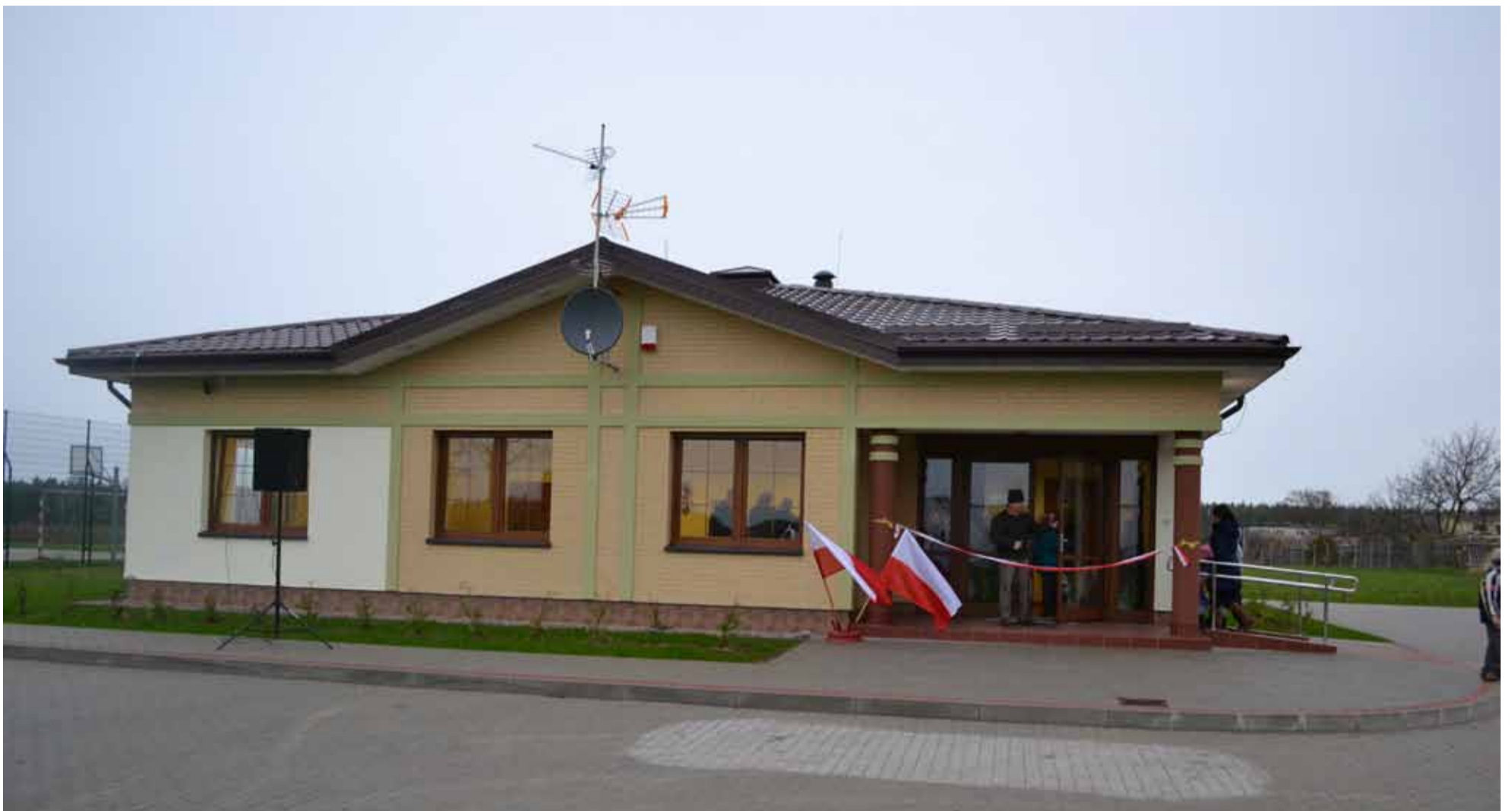
Otwarcu świetlicy w Kukowie towarzyszyło dużo emocji.