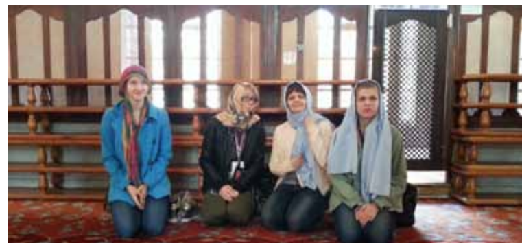
Młodzież z Siemianic mogła poznać obcą kulturę.

Grupa nauczycieli i uczniów z Siemianic byli pod dużym wrażeniem organizacji pracy szkoły, a także jej nowoczesnego wyglądu i wyposażenia. Szkołę wybudowano 2 lata temu, stworzono bardzo komfortowe warunki do nauki dla około 300 uczniów. Najbardziej zaskakujące było laboratorium, sala konferencyjna ze sceną, kawiarnia, a także przestronność sal lekcyjnych.