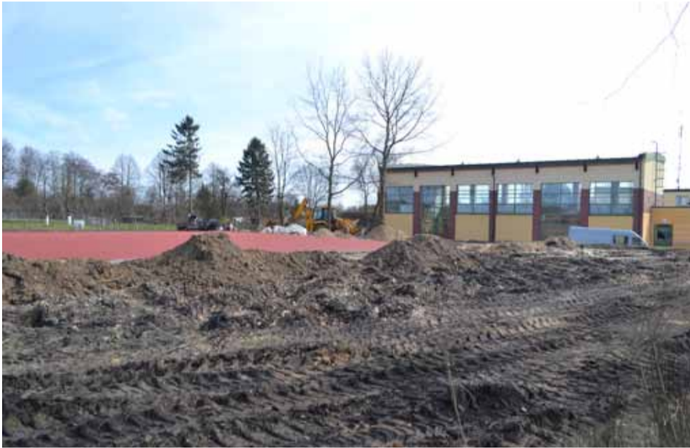
Boisko wielofunkcyjne przy szkole we Włynkówku już niebawem powinno być gotowe.

Początek każdego roku dla samorządu to ogłoszenie przetargów, wybór wykonawców i oczekiwanie na aurę sprzyjającą rozpoczęciu prac budowlanych. Na terenie całej gminy Słupsk ruszyły budowy dróg, chodników i ścieżek rowerowych. Cały czas ogłaszane są kolejne przetargi, dzięki którym sukcesywnie będą rozpoczynały się kolejne prace. Poniżej przedstawiamy najważniejsze z tych aktualnie prowadzonych.