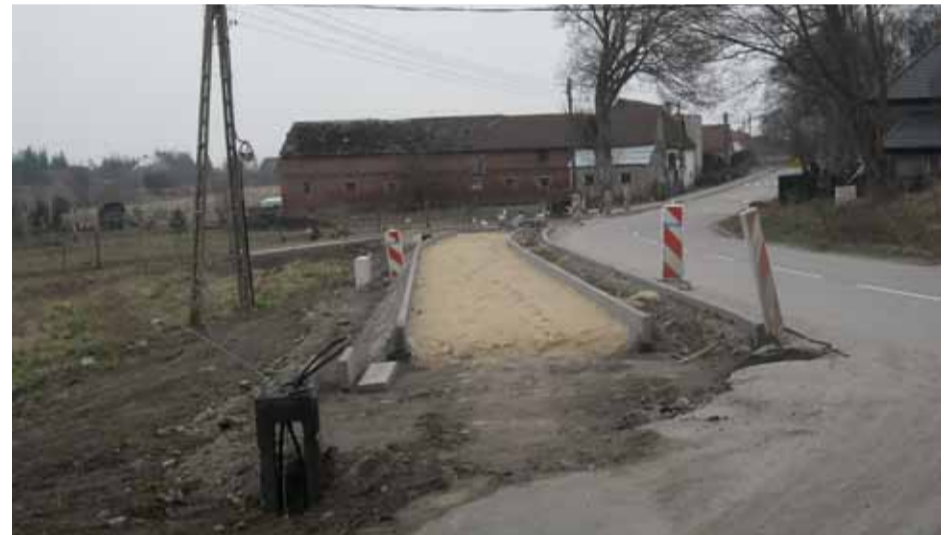
Bruszkowie Wielkie i Wielichowo połączy nowa ścieżka rowerowa.