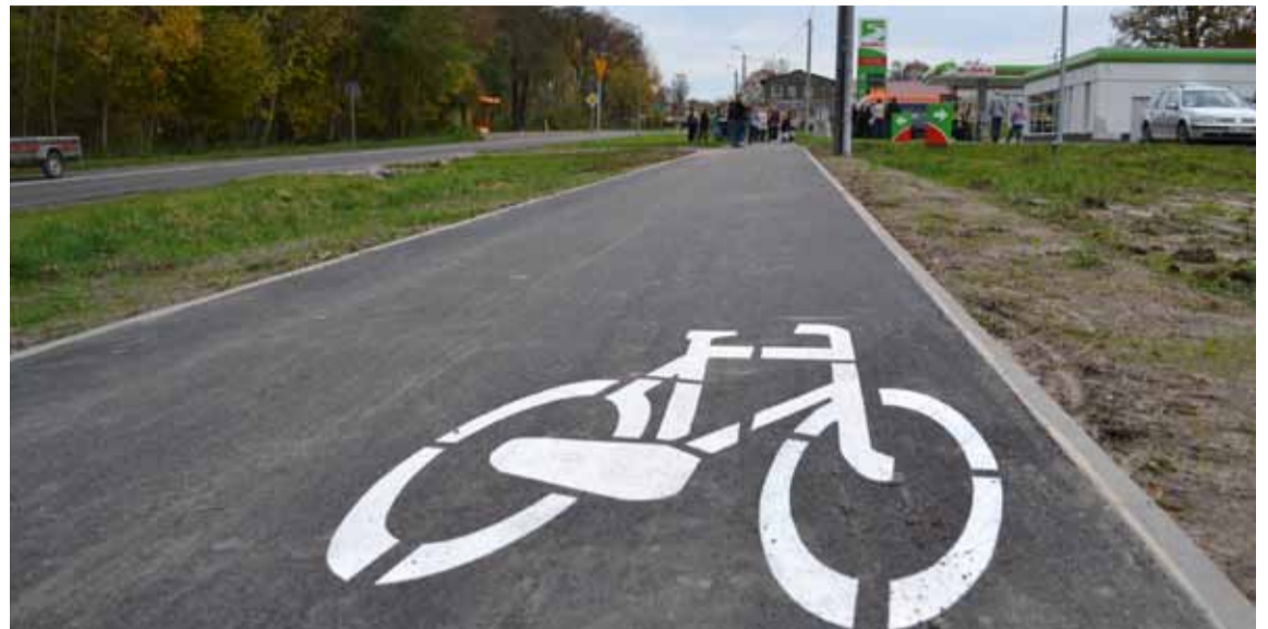
Ścieżka rowerowa w Globinie jest intensywnie użytkowana.

Zbliża się czas podsumowania minionego roku. Tradycją stała się już broszura budżetowa, która również w tym roku dotrze do wszystkich gospodarstw w gminie Słupsk. Zapraszamy do przeczytania.