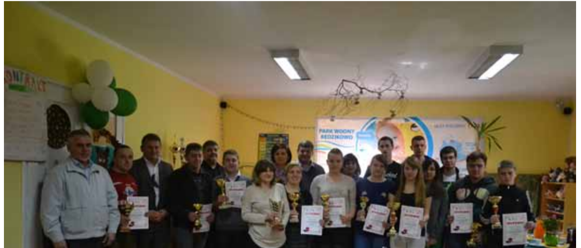
Zwycięzcy otrzymali puchary, dyplomy i upominki, o które zadbałi sponsorzy i organizatorzy.