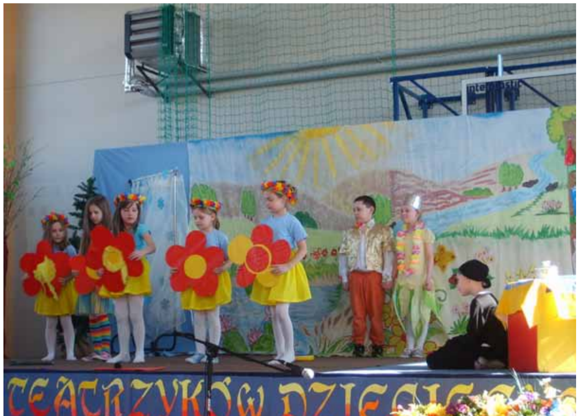
Scena z „Calineczki” w wykonaniu gospodarzy – uczniów szkoły we Włynkówku.