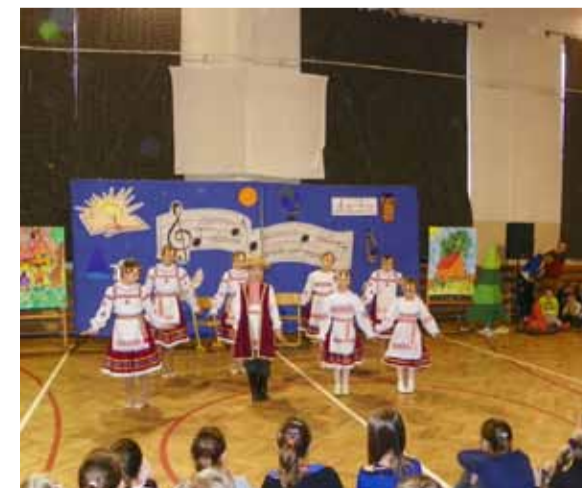
...i tańczyli. Uczniowie z Siemianic również.