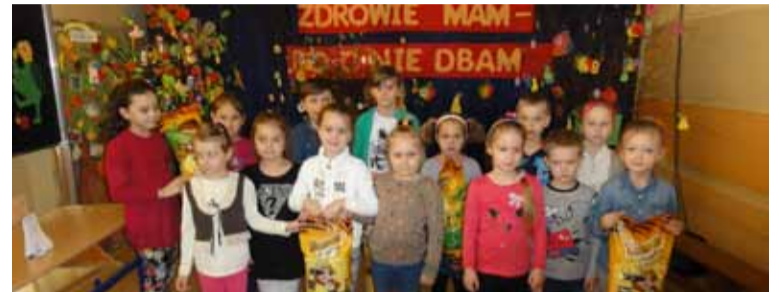
Uczniowie z Głobina już znają receptę na zdrowe życie

pracownika Poradni Psychologiczno – Pedagogicznej i funkcjonariusza Wydziału Prewencji Komendy Miejskiej Policji w Słupsku. Wszyscy uczniowie wysłuchali ciekawych pogadanek, ale zdecydowanie najchętniej zaprezentowali swe możliwości i umiejętności w jeździe na rowerze, pokonując tor przeszkód przygotowany przez pracowników WORD, oraz pokonywali slalom, mając założone algogogle - symulujące zaburzenie zmysłów jak u osoby będącej pod wpływem