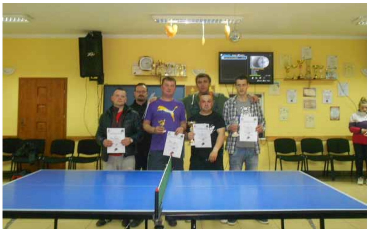
Były emocje i walka. Po nich pamiątkowe zdjęcia.

Organizator składa serdeczne podziękowania wszystkim uczestnikom oraz sympatykom i kibicom tłumnie przybyłym do świetlicy.