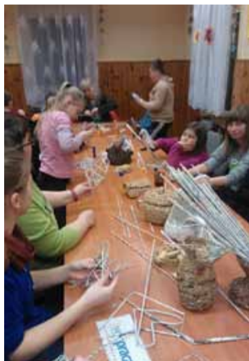
Wiklina papierowa bardzo spodobała się uczestnikom warsztatów.

Warsztaty odbyły się już w świetlicach wiejskich w: Bruszkowie Wielkim, Lubuczewie, Kukowie, Rogawicy, Włynkówku, Jezierzycach Osiedlu. Zainteresowanie wikliną papierową jest ogromne wśród dzieci i dorosłych. To również doskonała okazja do aktywizowania i integracji lokalnej społeczności.