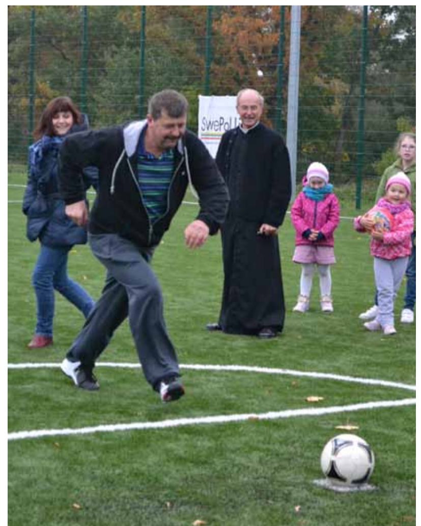
Pierwsze strzały na boisku wielofunkcyjnym w Bruszkowie Wielkim.