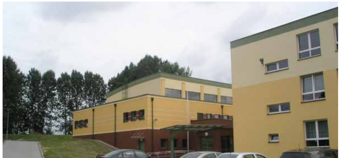
Budowa sali gimnastycznej i świetlicy wiejskiej we Włynkówku to największa inwestycja zakończona w zeszłym roku.