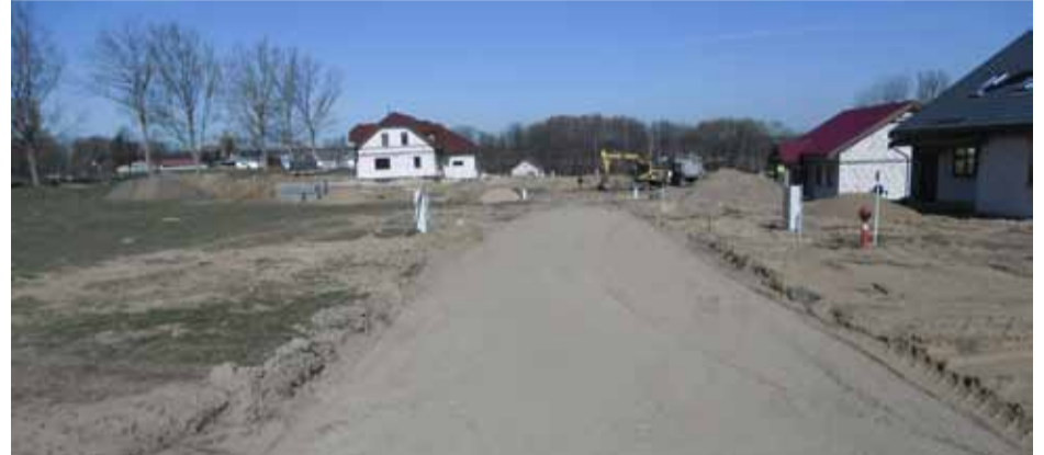
W Bydlinie trwa budowa drogi gminnej.