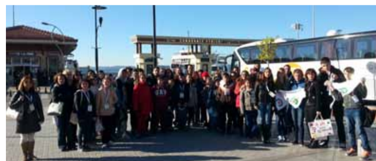
Projekt Comenius to okazja do spotkań wielu narodów.