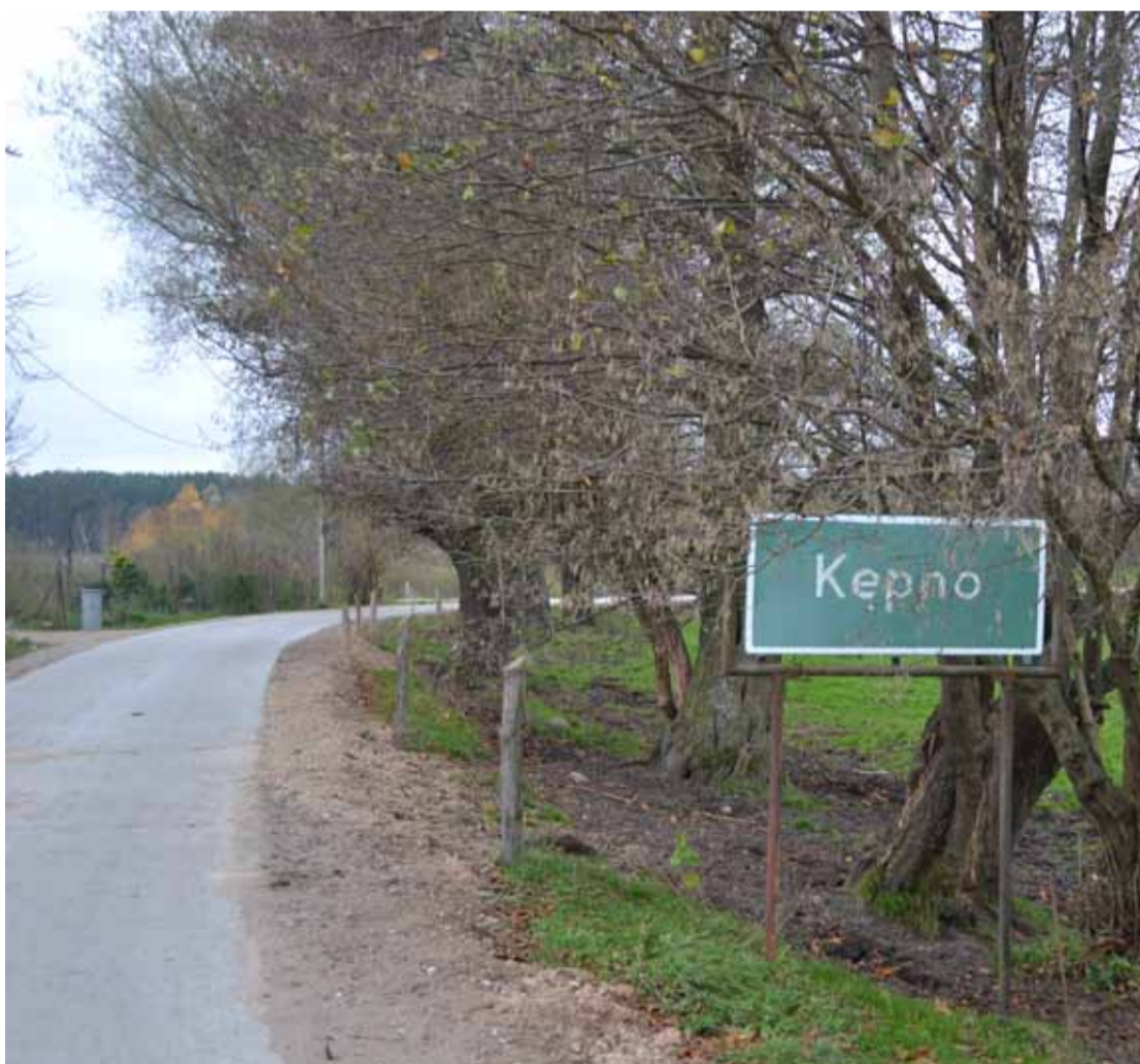
Droga Wrzeście – Kępno w momencie oddania do użytku była najdłuższą w Polsce wykonaną techniką betonu wałowanego.