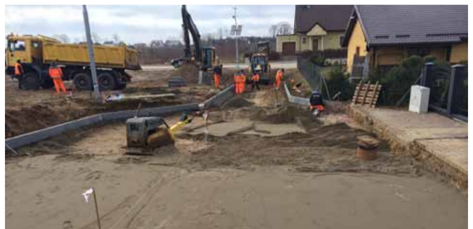
Ulica Spokojna w Głobinie. Tutaj budowany jest ciąg pieszo – jezdny z kostki betonowej. Powstaną też dojścia do posesji.