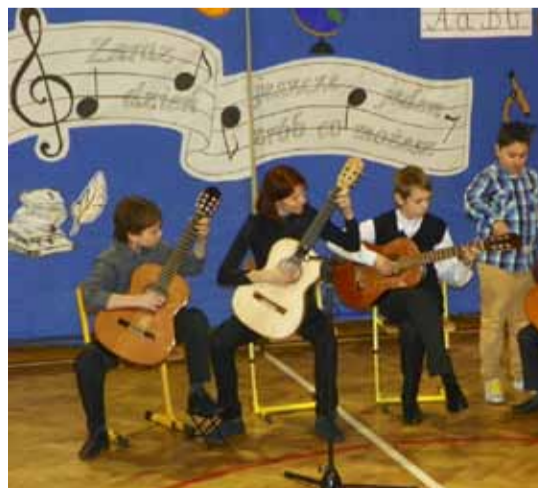
Młodzi artyści z Białorusi grali, śpiewali...