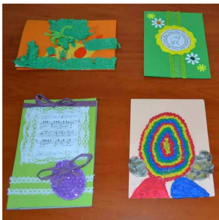
4 zwycięskie kartki. Gratulujemy.

zasługą wszystkich, dla których ważny jest rozwój naszej małej ojczyzny. Dziękujemy mieszkańcom, przedsiębiorcom, społecznościom lokalnym, pracownikom. Wspólna, codzienna praca, w osiągnięciu wcześniej określonych i zaplanowanych celów, sprawia, iż gmina Słupsk rozwija się tak dynamicznie. Mamy nadzieję, że nasze dalsze działania przyczynią się do osiągnięcia równie wysokich lokat w innych rankingach.