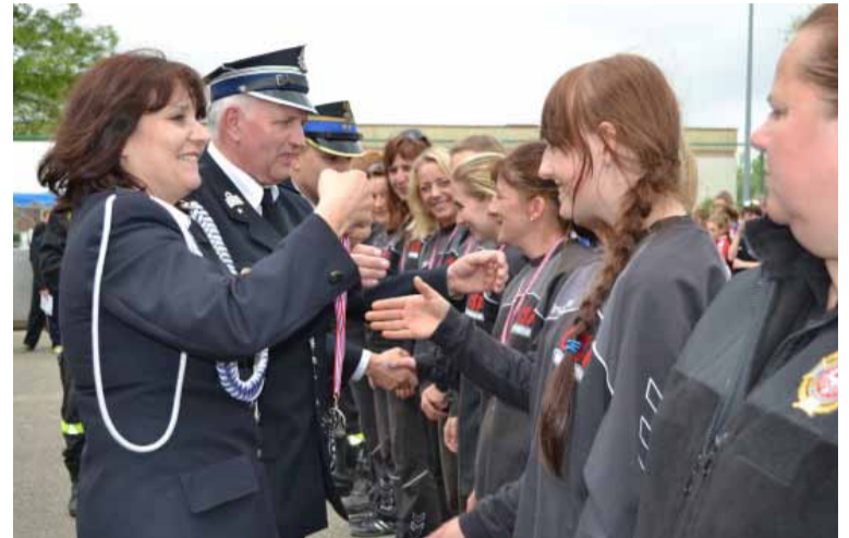
Pani wójt, czyli prezes gminnych OSP uhonorowała wyróżniających się strażaków.