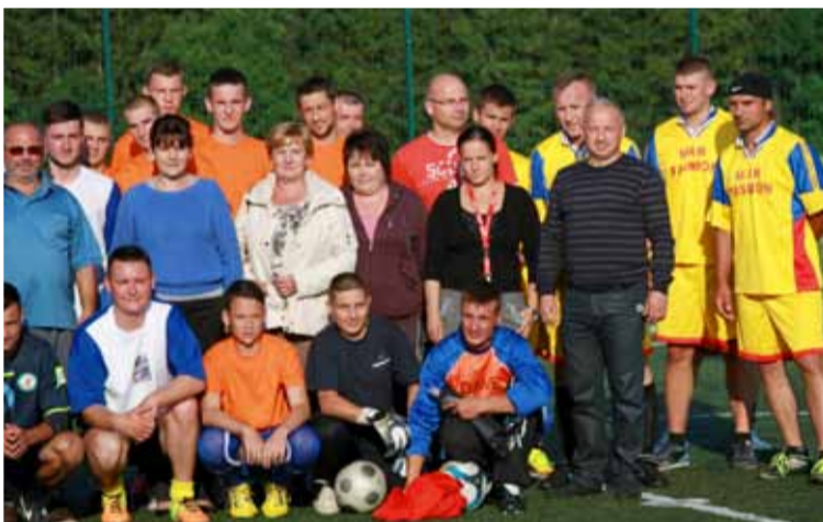
To pierwsza edycja letniego turnieju. Grono uczestników pewnie zwiększy się w kolejnych.