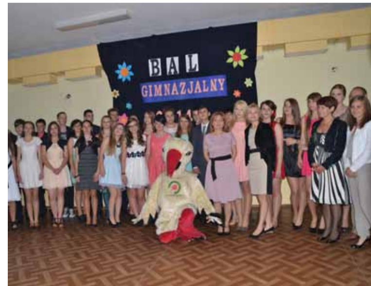
Pod koniec czerwca odbywały się bale gimnazjalne. Gimnazjalistów z Redzikowa odwiedził bocian, życząc sukcesów absolwentom.

Gratulujemy i życzymy dalszych sukcesów.