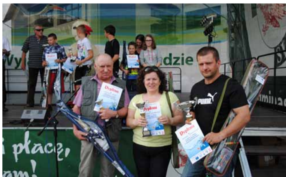
Zawody wędkarskie rozegrane zostały o poranku.