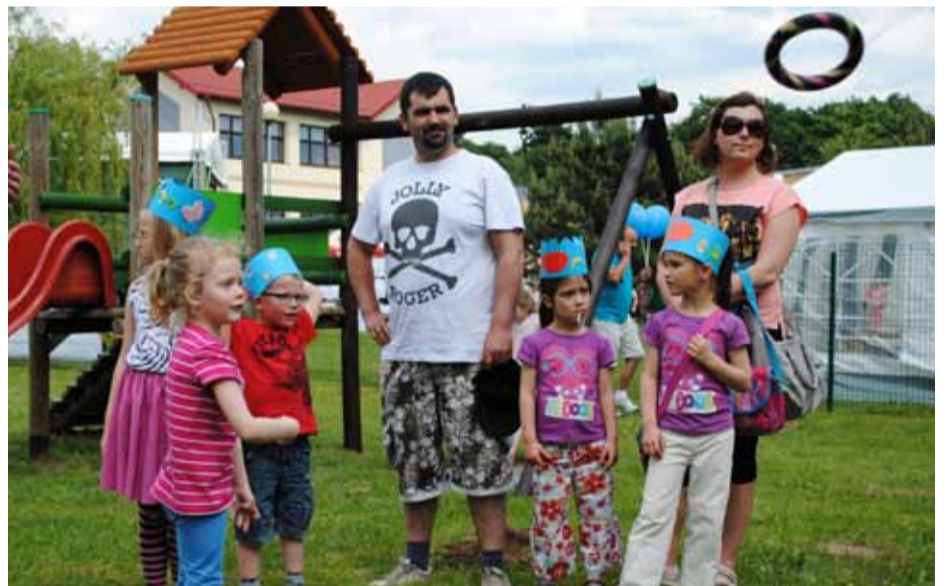
Konkursy w Strefie Malucha cieszyły się dużym powodzeniem.