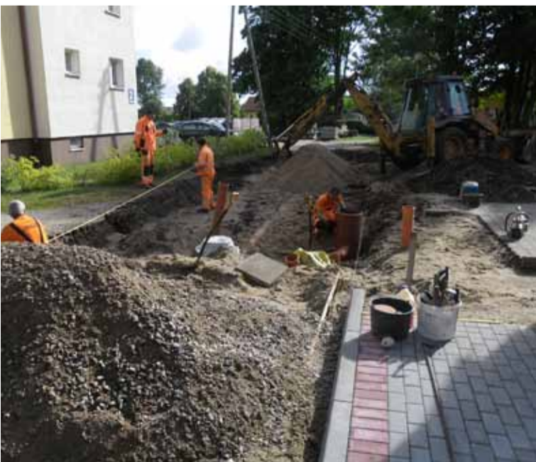
Trwa przebudowa ulicy Klonowej w Jezierzycach. Przewidziano także budowę zatok postojowych oraz chodnika.