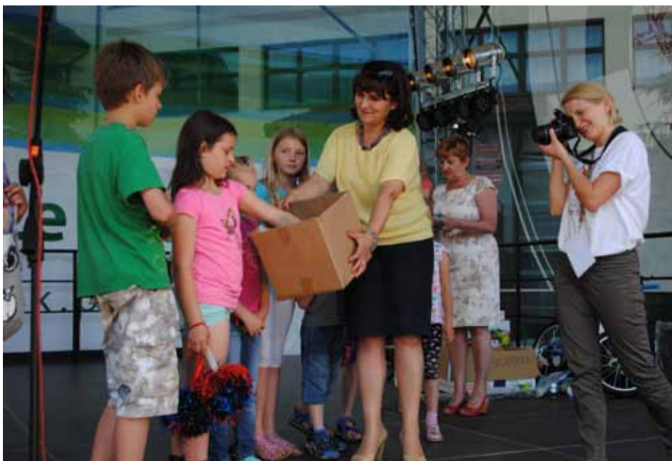
Zwycięzców konkursu z „broszury budżetowej” losowali najmłodszy uczestnicy festynu.