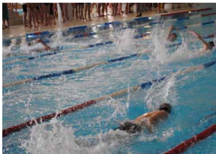
Wyścigom pływackim towarzyszyły niemałe emocje.

Komplet wyników do sprawdzenia stronie internetowej gminy Słupsk, zdjęcia dostępne na facebook'owym profilu gminy Słupsk.