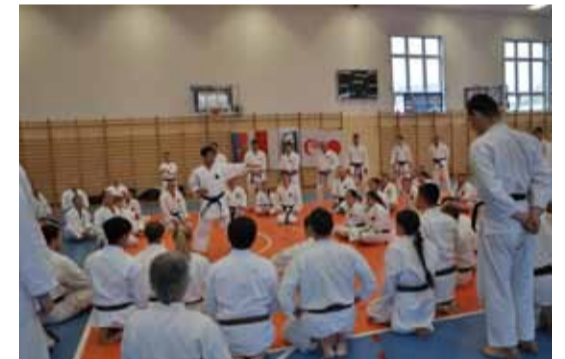
W karate każdy ruch ma znaczenie, dlatego tak ważne są systematyczne treningi pod okiem najlepszych instruktorów.

Dla tych, którzy pierwsze kroki w karate mają już za sobą, w listopadzie zorganizowany zostanie drugi