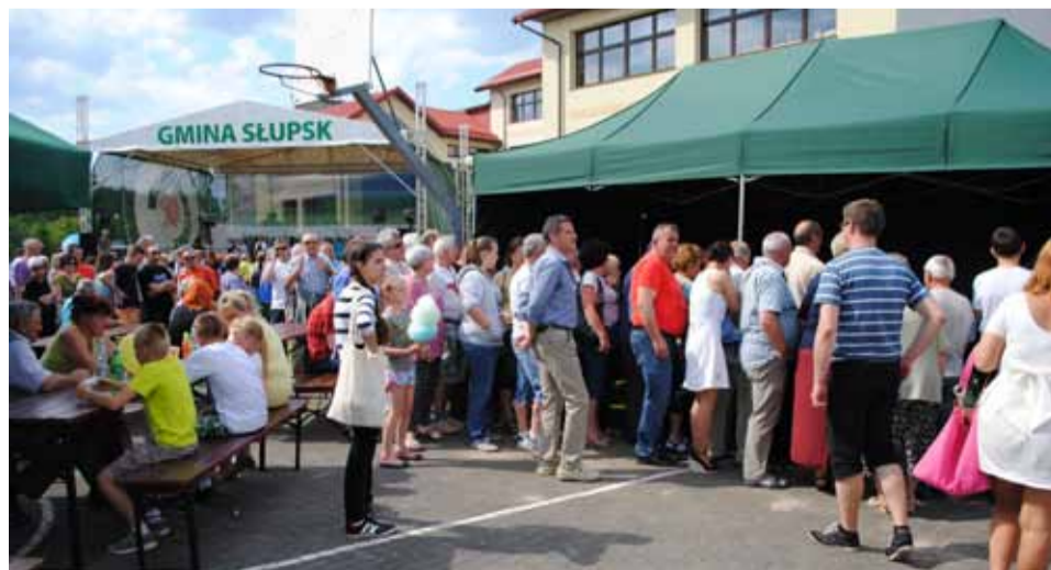
Pogoda dopisała, frekwencja również. Tłumy przewinęły się przez stoiska gastronomiczne.