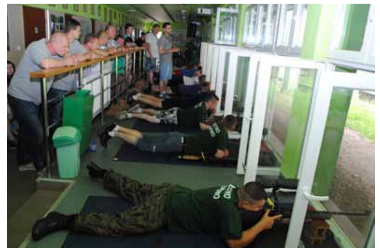
Strzały z karabinu KBKS były oddawane z dużego dystansu.

Zwycięzcy w swoich kategoriach otrzymali puchary oraz dyplomy.