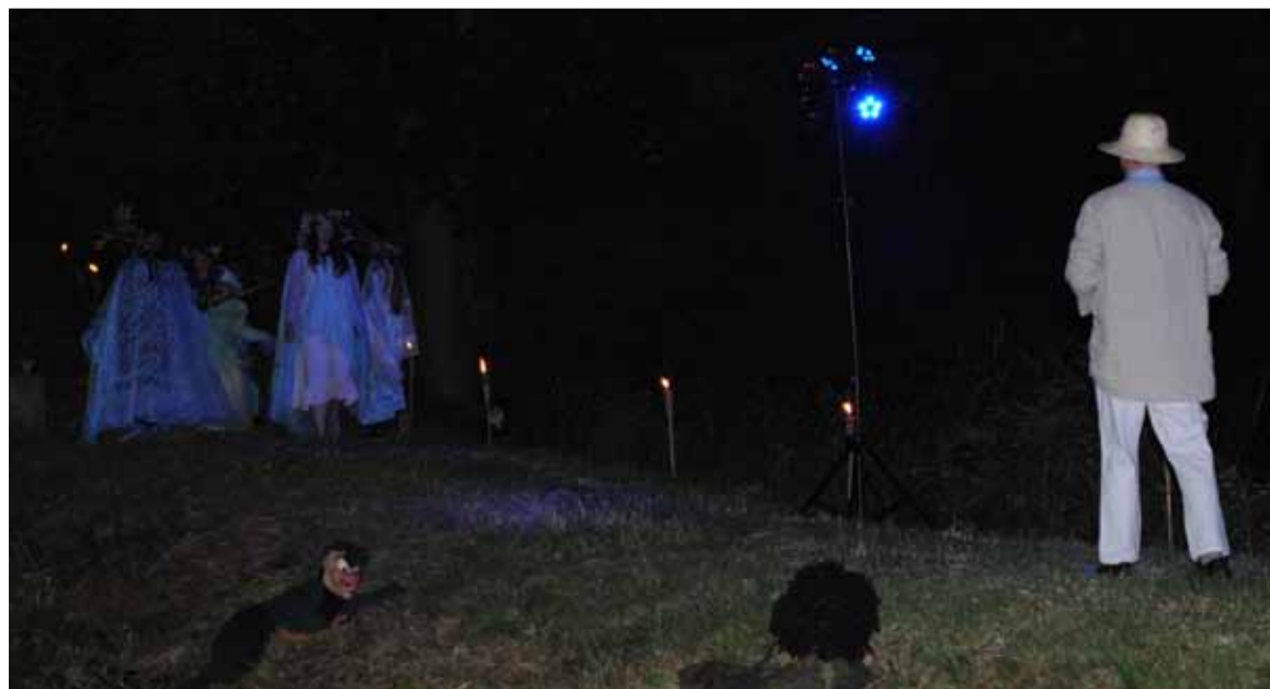
2 tygodnie intensywnych przygotowań dało wspaniały efekt widowiska.