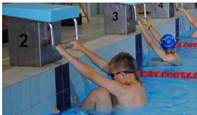
Większość uczestników zawodów to młodzież ze szkół gminy Słupsk.