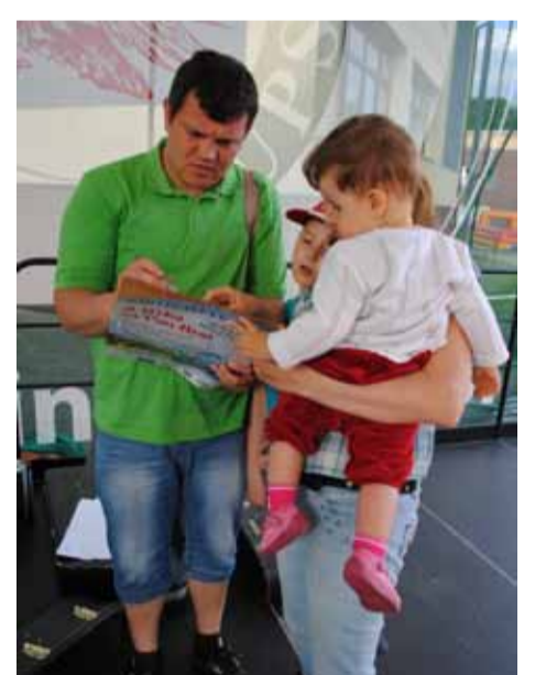
Na scenie odbył się konkurs rodzinny.

UNIA EUROPEJSKA EUROPEJSKI FUNDUSZ RYBACKI