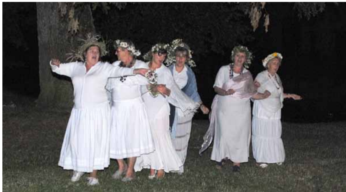
Świteziankom w śpiewie nie przeszkadzała nawet ulewa.

- Strażaków OSP Kusowo za efekty specjalne.