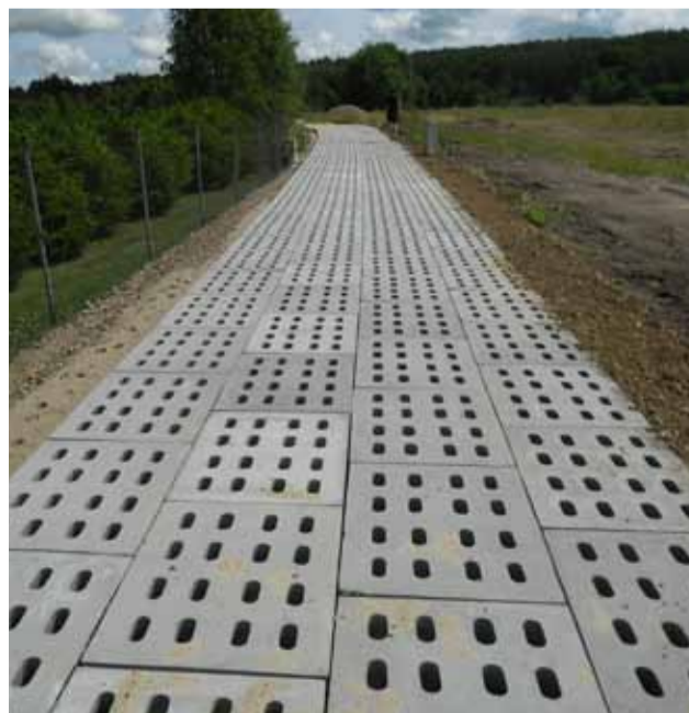
Droga gminna w Niewierowie została wyłożona pyłami drogowymi JOMB. Łączna długość to ponad 360 m.