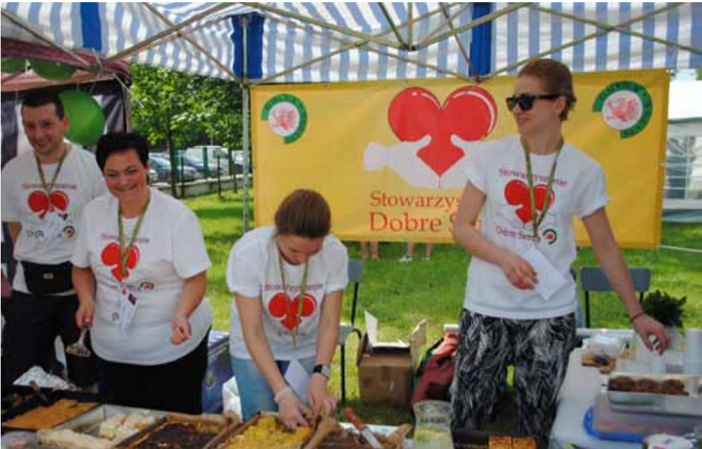
Stowarzyszenie „Dobre Serca” przygotowało mnóstwo słodkości.