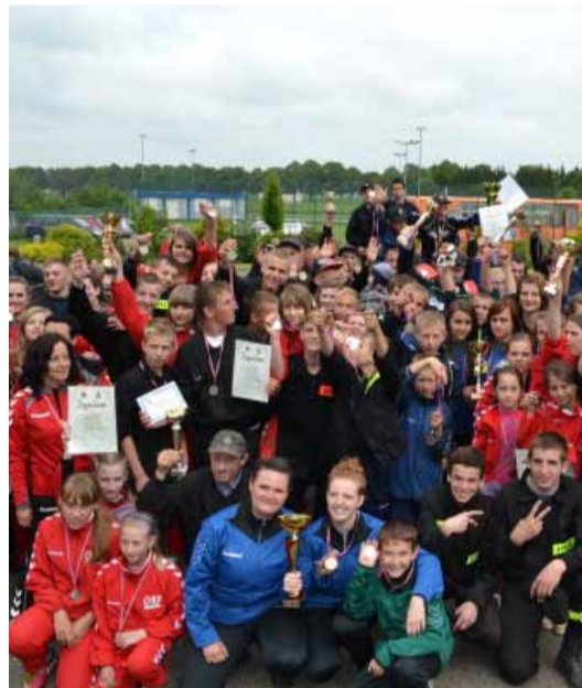
Uczestnicy gminnych zawodów pożarniczych.