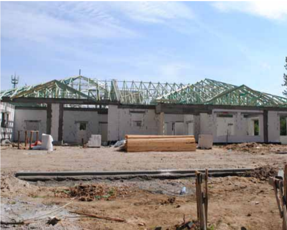
W Gałęzinowie jeszcze w tym roku oddana zostanie do użytku świetlica wiejska wraz ze strażnicą OSP.