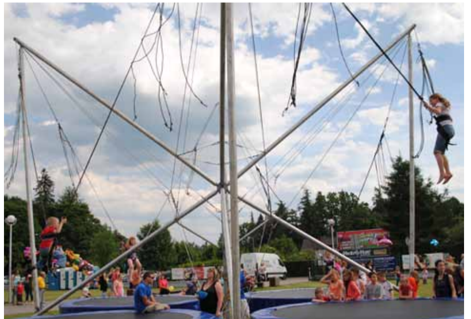
Wszystkie dzieci mogły skorzystać z bezpłatnych atrakcji.