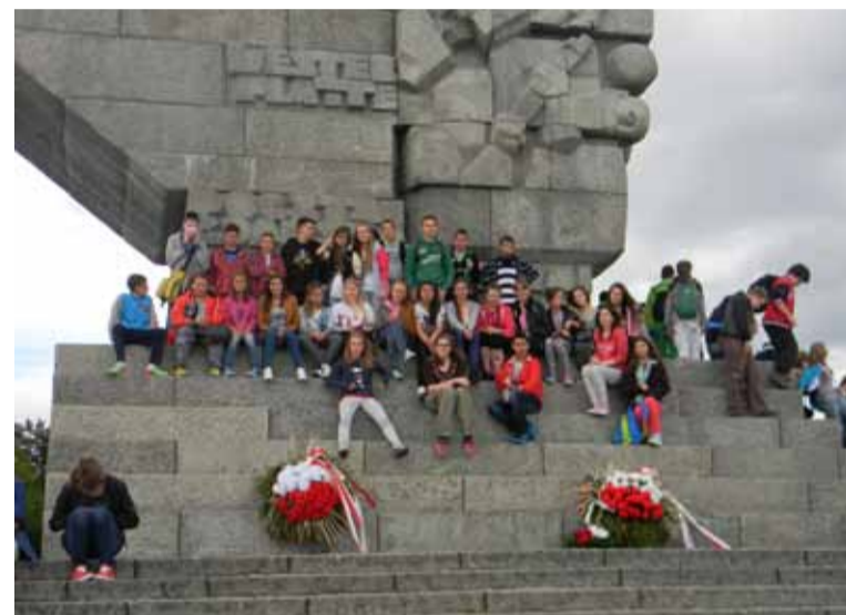
Podręcznik to nie wszystko. Uczniowie z Jezierzyc mogli odwiedzić miejsca związane z II wojną światową.