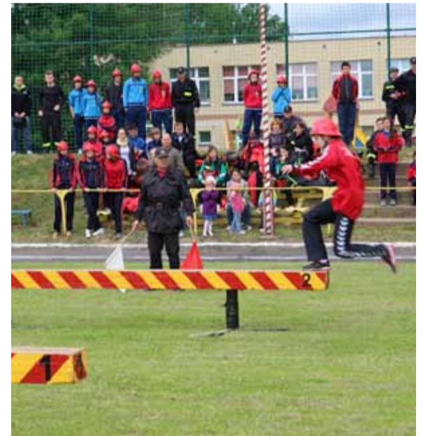
W zawodach powiatowych świetnie zaprezentowało się OSP Gałęzinowo.