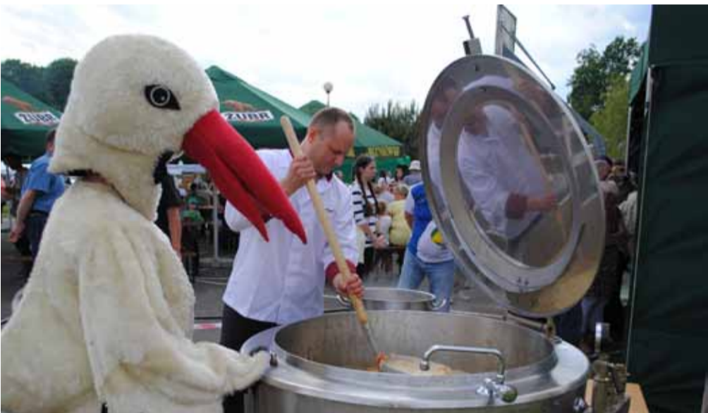
Nawet bocianowi zasmakowała zupa rybna. Na gości czekało 1000 porcji smakołyku.