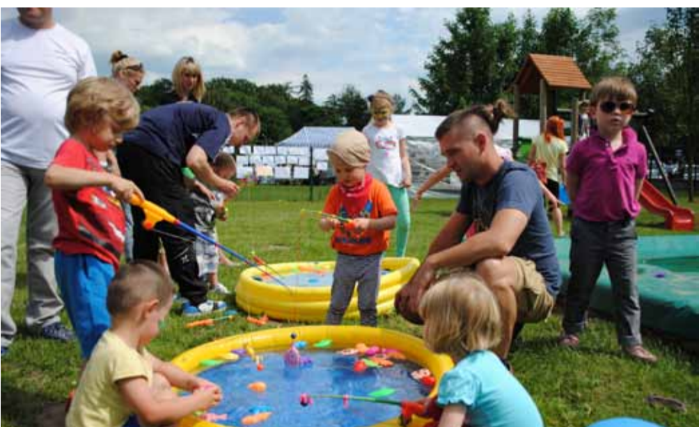
Nie tylko dorośli brali udział w konkursie wędkarskim.