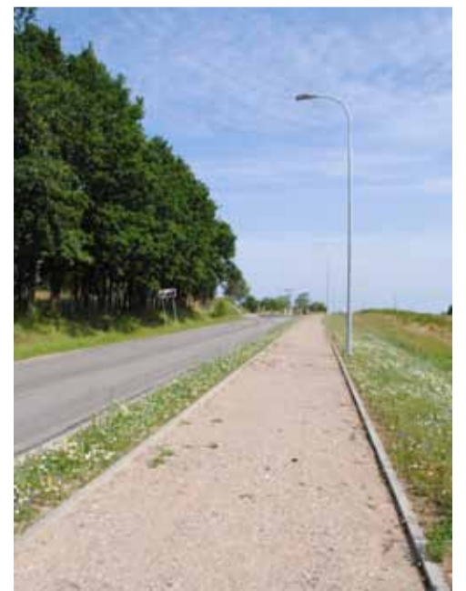
Wciąż trwają prace nad budową ścieżki rowerowej, która już niedługo połączy Wielichowo z Bruszkow Wielkim.