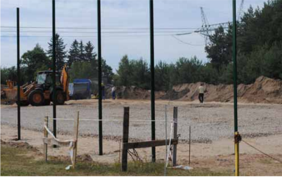
W Siemianicach powstanie kolejne boisko. Tutaj będzie można grać m.in. w koszykówkę i siatkówkę