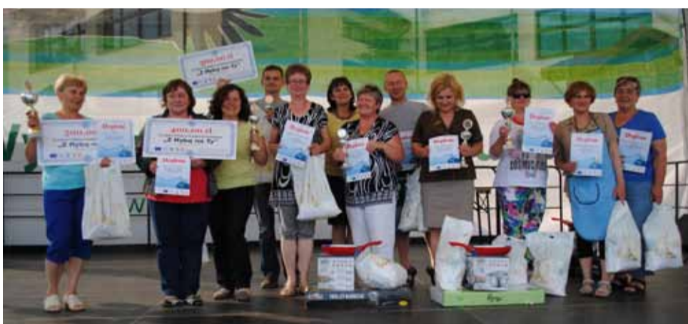
Laureaci konkursu kulinarnego „Z Rybą Na Ty”