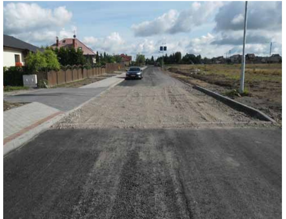
Trwa przebudowa ulicy Rzemieślniczej w Siemianicach. Wzdłuż drogi zbudowany zostanie również chodnik.