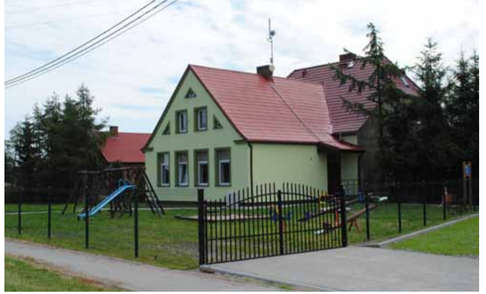
Remont świetlicy wiejskiej w Krzemienicy już zakończony. Budynek doczekał się nowej elewacji, teren ogrodzono, a przed nim utworzono parking.