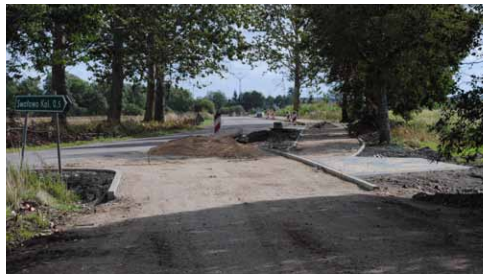
Dzięki utwardzeniu drogi z Bruskowa Wielkiego, do Swolowa pojedziemy na skrót.