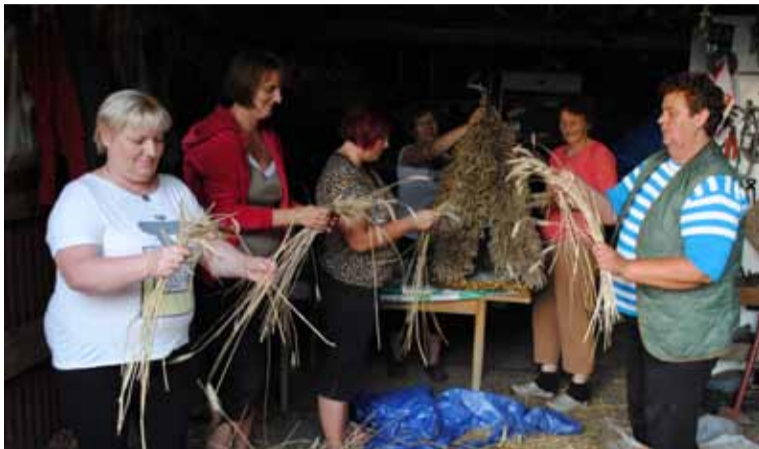
Panie z Wrześcia postanowiły zrobić wieniec, który miał stać w kościele. Już w trakcie prac zdecydowały, że będzie również reprezentował sołectwo podczas gminnych dożynek w Swolowie. Życzymy powodzenia w konkursie

Wzmianka o wsi Wressow pochodzi z 1285 r. Wrzeście pierwotnie było wielodrożnicą, którą w 1285r. Mestwin II podarował klasztorowi w Białobuku