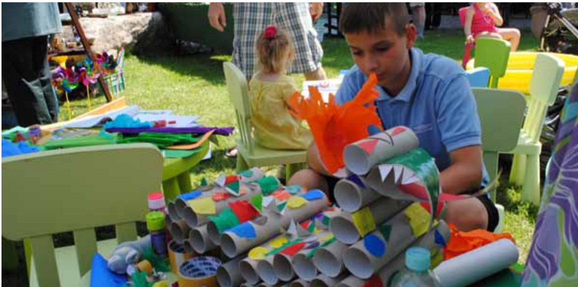
Tak powstawał eko-smok.

i w namiotach można było zakupić specjalne autorstwa Kół Gospodyń Wiejskich z Redzikowa, Włynkowa, Wiklina i Lubuczewa. Najmłodszy korzystali z bezpłatnej strefy malucha, w której oprócz gier i zabaw, można było wziąć udział w konstruowaniu smoka z materiałów ekologicznych. W namiocie promocyjnym gminy Słupsk, można było zaciągnąć informacji, w jaki sposób gmina Słupsk „przytuli” osoby, które chciałyby w niej zamieszkać. Upał nie przeszkodził wystawcom ani uczestnikom jarmarku w ciekawym spędzeniu niedzieli. Wszyscy opuścili plac przed Muzeum Pomorza Środkowego z uśmiechami na twarzach.