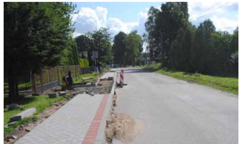
Pierwsze efekty budowy chodnika w Bierkowie. Inwestycja biegnie wzdłuż ulicy Grodzkiej od centrum miejscowości aż do drogi powiatowej.