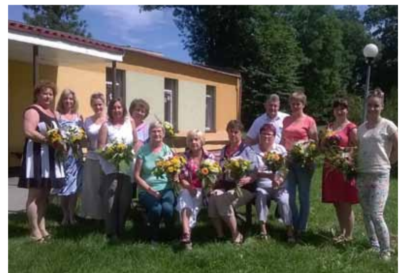
Udział w warsztatach zapewni świetliczankom niezbędną wiedzę i kwalifikacje potrzebne w codziennej pracy na rzecz mieszkańców lokalnych środowisk wiejskich.

kich na rok 2014 wartość dotacji wynosi 39 510, 00 złotych, natomiast całkowita wartość projektu to 48 460, 00 złotych. Partnerami w projekcie są: Gminny Ośrodek Kultury Gminy Słupsk oraz Wydawnictwo „Szarek”.