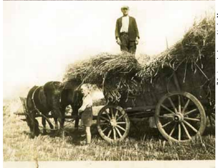
Podczas tegorocznych dożynek spróbujemy przenieść Was w czasie.