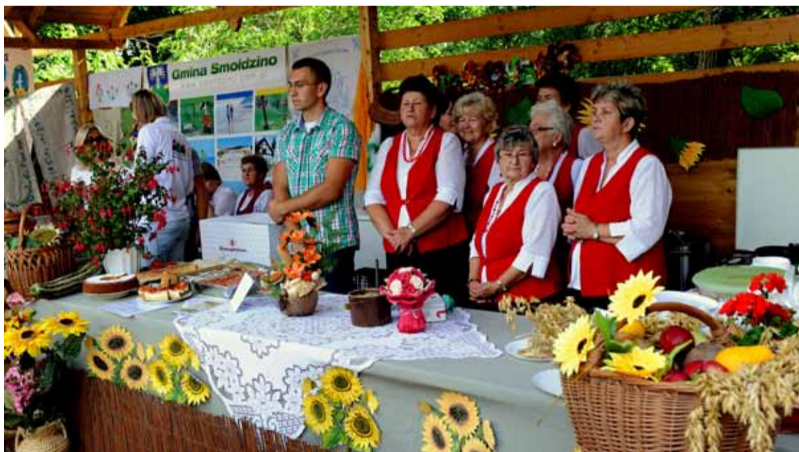
Bogate stoiska gmin powiatu słupskiego będziemy mogli odwiedzić podczas dożynek powiatowych. Zapraszamy 31 sierpnia do Kobylnicy.