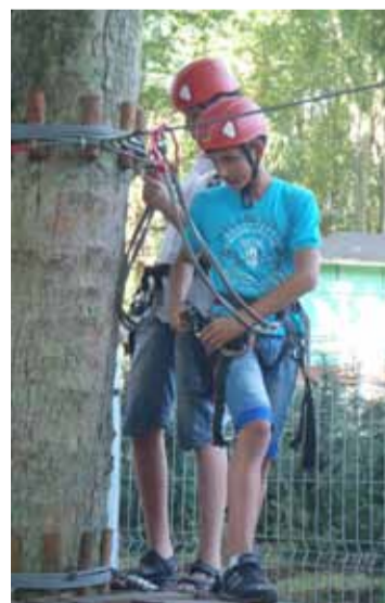
Podobno najlepiej wspina się po drzewach w Parku Linowym „Leśny Kot”.