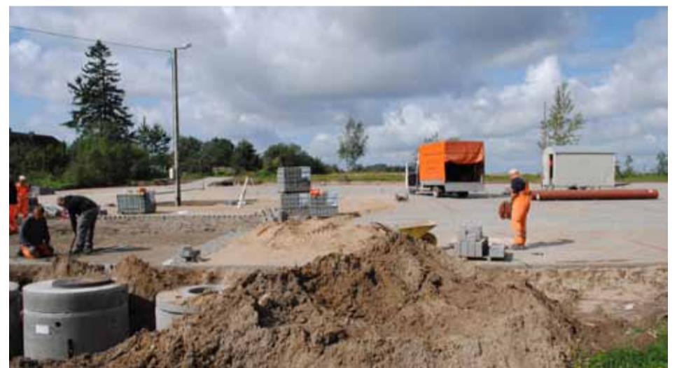
W Swolowie, przy wjeździe do miejscowości od strony Krzemienicy powstaje parking. Będzie gotowy na gminne dożynki.