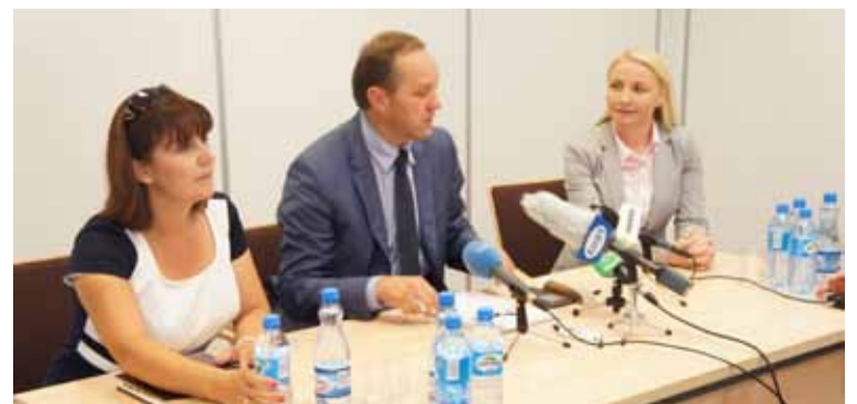
Podczas konferencji prasowej w Słupskim Inkubatorze Technologicznym padło wiele deklaracji pomocy dla gminy Słupsk jak i całego regionu.

Wizyta Marszałka pozostawiła nie tylko miłe wspomnienia, ale także dała nadzieję na przyspieszenie realizacji oraz pomoc w wielu ważnych dla Gminy Słupsk, oraz całego regionu spraw.