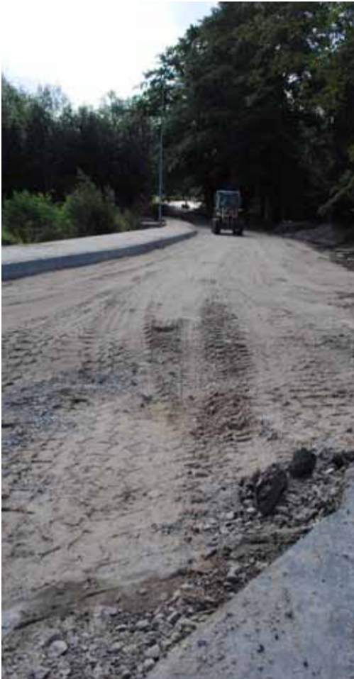
We Włynkówku trwa remont Alei Nad Rzeką. Modernizowany jest odcinek od przedszkola do ulicy Słonecznej.