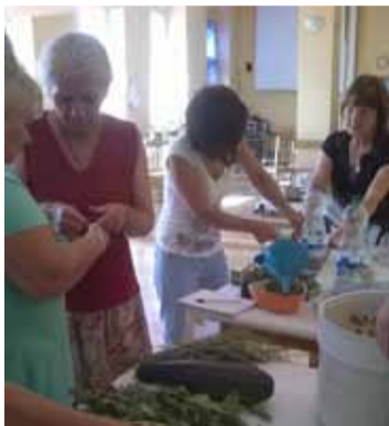
Festyn zielarski odbędzie się 30 sierpnia w Krępie Słupskiej.

W Krępie Słupskiej trwa realizacja projektu pn. „Ludowe tradycje zielarskie w sołectwie Krępa Słupska”. Celem głównym projektu jest aktywizacja 12 mieszkańek sołectwa Krępa Słupska poprzez cykl warsztatów kulturalno – oświatowych oraz wzrost wiedzy o tradycjach regionalnych mieszkańców z terenu gminy Słupsk i gmin ościennych przez przygotowanie wydarzenia kulturalnego w oparciu o tradycje zielarskie. W ramach projektu panie od kwietnia br. miały możliwość pozyskania wiedzy poprzez udział