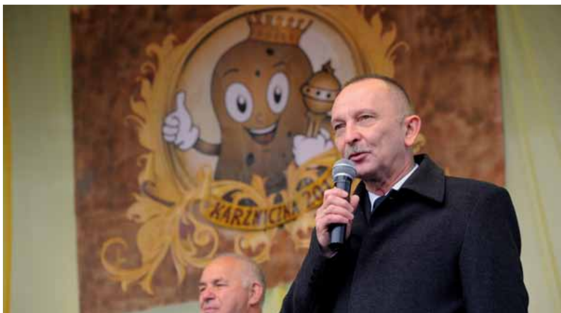
Słupskie Pokopki w Karzniczce, czyli Powiatowe Święto Ziemiaka to tradycja. W tym roku zapraszamy 5 października.