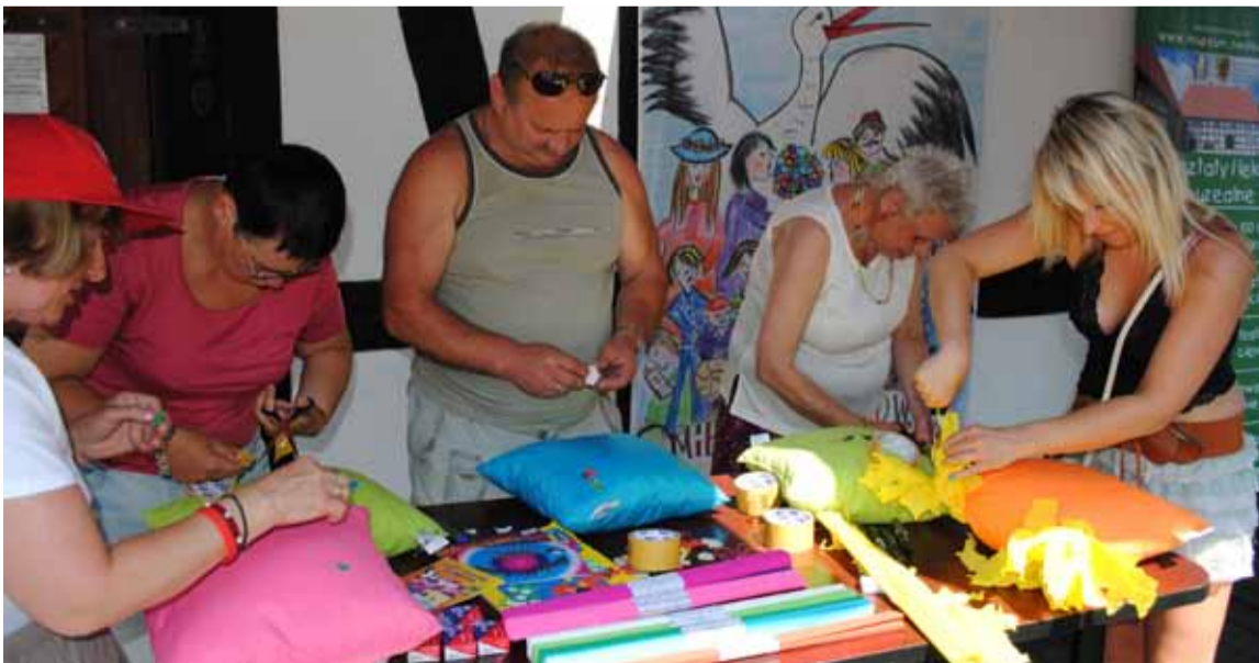
Wszystkie konkursy miały związek z przytulaniem. Jedną z nich było zdobienie poduszki przytulanki.