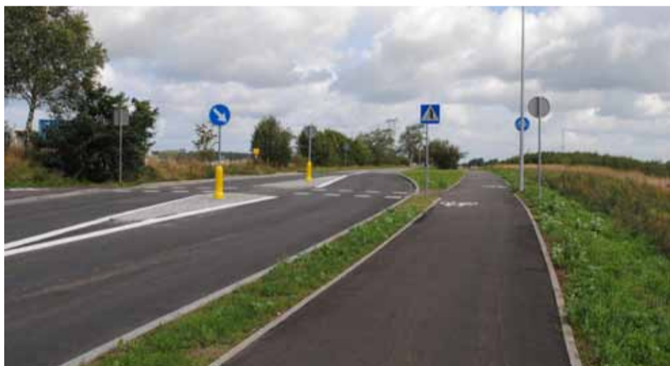
Ścieżka rowerowa Bruskowo Wlk. – Wielichowo już została oddana do użytku.