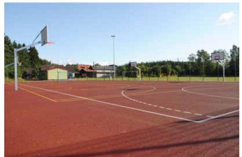
Przy boisku Szansy Siemianice powstało nowe wielofunkcyjne boisko.