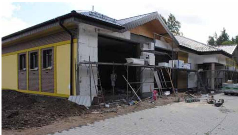
Jeszcze tej jesieni otwarta będzie nowa świetlica ze strażnicą OSP w Gałęzinowie. Budowany jest również dojazd do nowego obiektu.