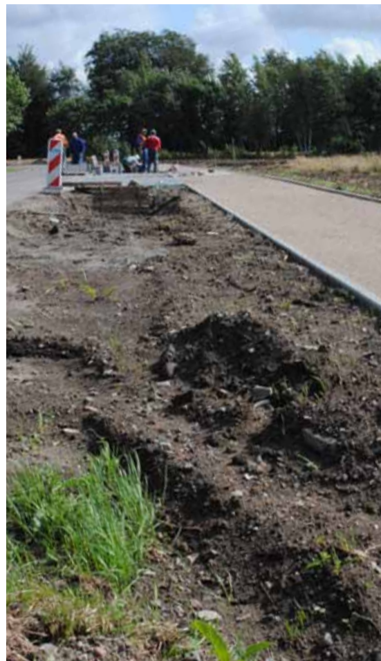
Bruskowo Małe – Krzemienica, tę trasę niedługo pokonamy bezpieczną ścieżką rowerową.