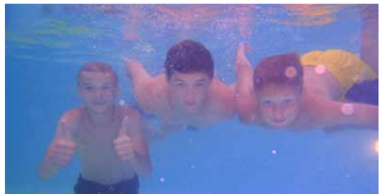
Bałtyk w tym roku był wyjątkowo zimny. Takie zdjęcia tylko w Parku Wodnym Redzikowo.