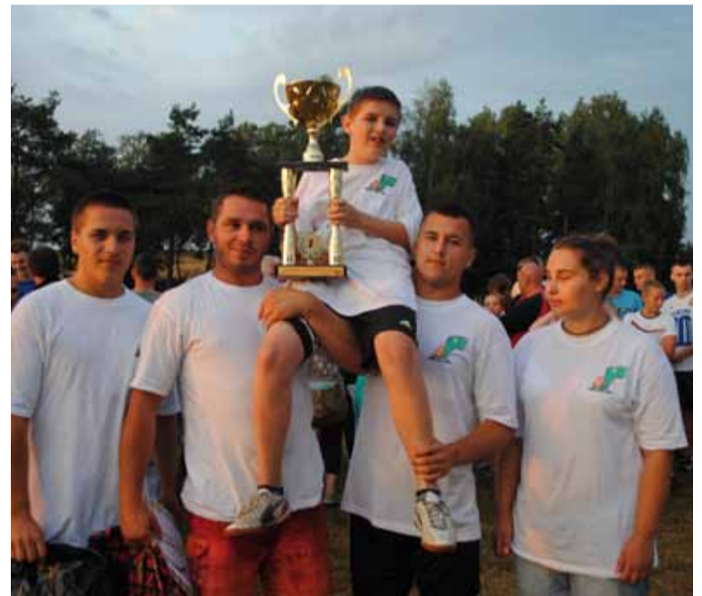
Czy reprezentacja Włynkówka w przyszłym roku uniesie zwycięski puchar po raz trzeci z rzędu?