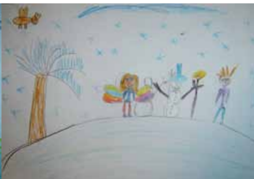
Ola R. - 8 lat