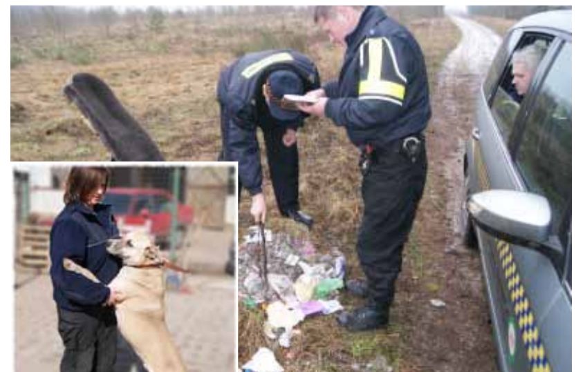
Ujawnianie „dzikich” wysypisk śmieci.