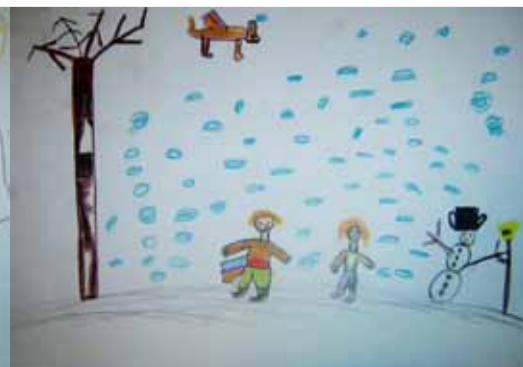
Kacper K. - 8 lat