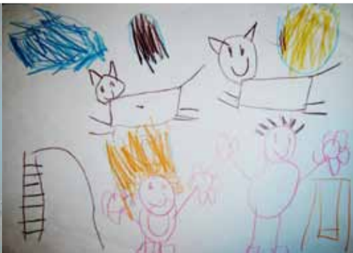
Adrian Sz. - 6 lat