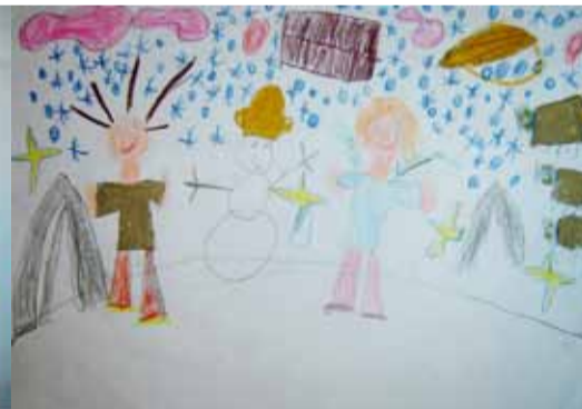
Dominika P. - 5 lat