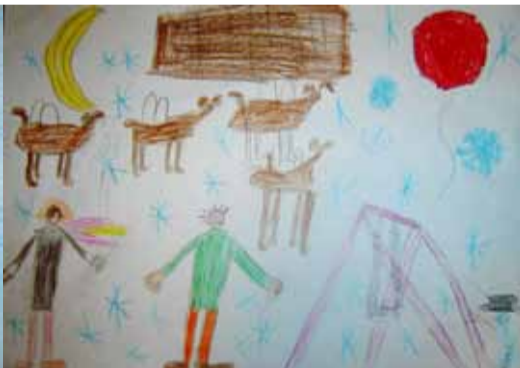
Wiktor S. - 7 lat