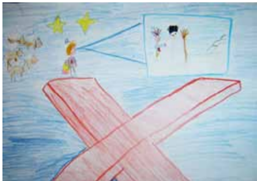
Roksana K. - 10 lat