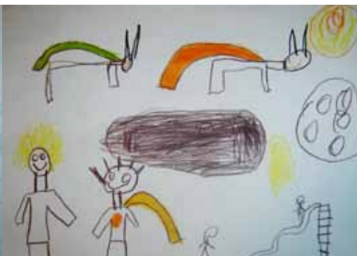
Alan - 6 lat