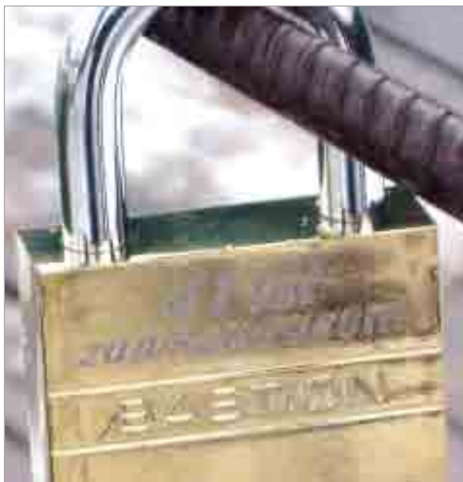
Mostek miłości w Krępie.

Takie formy promocji stają się coraz bardziej popularne. Mostki miłości w naszym kraju zlokalizowane są między innymi we Wrocławiu czy w Poznaniu. Ten sposób wyznawania uczucia spodobał się również mieszkańcom Krępy Słupskiej. Podejmując wspólną inicjatywę utworzyli oni w centrum miejscowości takie oto miejsce. Niewielki mostek na rzece Głaźna, opatrzony został w stosowną tablicą pt. „Mostek miłości”. Dodaje on uroku sąsiadu-