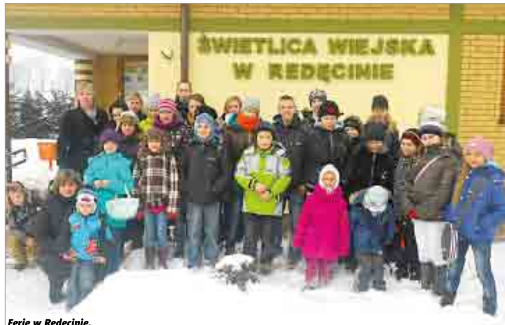
Ferie w Redęcinie.

Ferie w Grąsinie zakończył bal karnawałowy. Również świetlica w Kusowie przygotowała dla swoich podopiecznych atrakcje na tegoroczne ferie. Zimowisko zorganizowane zostało w dniach 30 stycznia-12 lutego. Największym zainteresowaniem cieszyły się zajęcia z decoupage. Na półmetku ferii została zorganizowana zabawa taneczna dla dzieci połączona z konkursami sprawnościowymi, tanecznymi. Tradycyjnie w drugim tygodniu zorganizowana była noc filmowa. Podczas ferii młodzież dowiedziała się także jak przeciwstawiać się nałogom. Znaczącą atrakcją tegorocznych ferii w Ku-