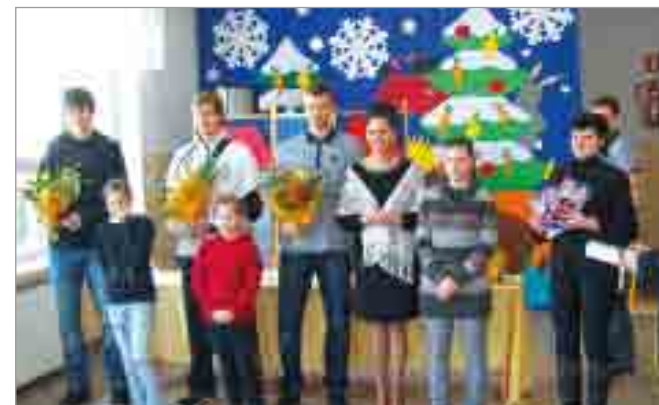
Koszykarze Energi Czarnych Słupsk.

Towarzyszyli im menedżerowie. Podczas szkolnej konferencji prasowej uczniowie zadawali pytania gościom, a odpowiedzi nagradzali brawami. Atmosfera była wspaniała! Koszykarze wręczali prezenty – piłki oraz plakaty. Reprezentanci słynnej drużyny przywieźli także zdjęcia. Po autografy utworzyła się długa kolejka chętnych uczniów. Następnie goście