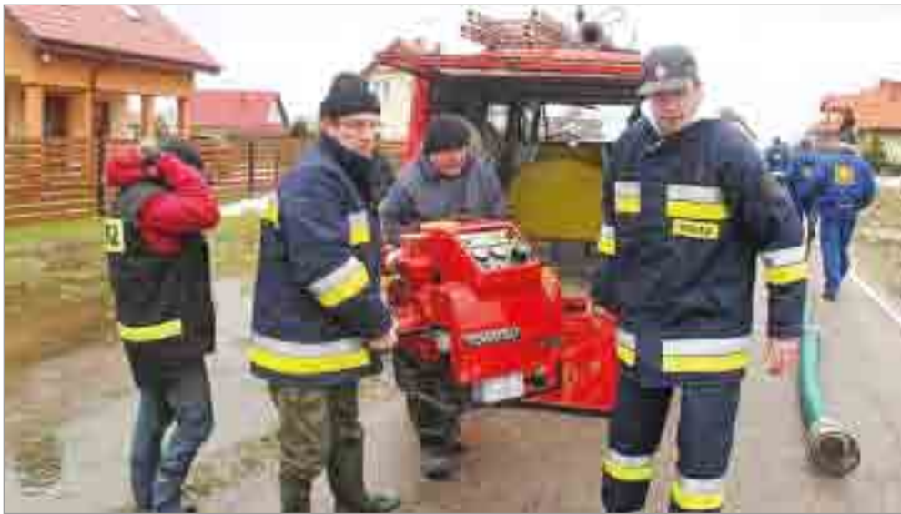
Gminne Jednostki OSP.

Niezastąpiona okazała się pomoc naszych Jednostek Ochotniczej Straży Pożarnej. W Lubuczewie spływająca woda utrudniła ruch drogowy na drodze wojewódzkiej Słupsk – Łeba oraz na drodze powiatowej Lubuczewo – Karzino. Woda wystąpiła z rowów zalewając pobliskie posesje. Przyczyną takiej sytuacji był między innymi brak przepustu