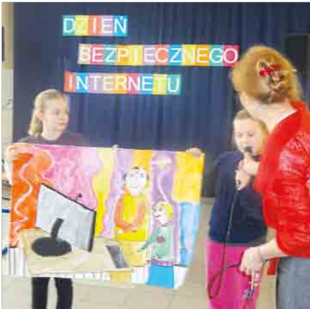
Dzień Bezpiecznego Internetu w Głobinie.