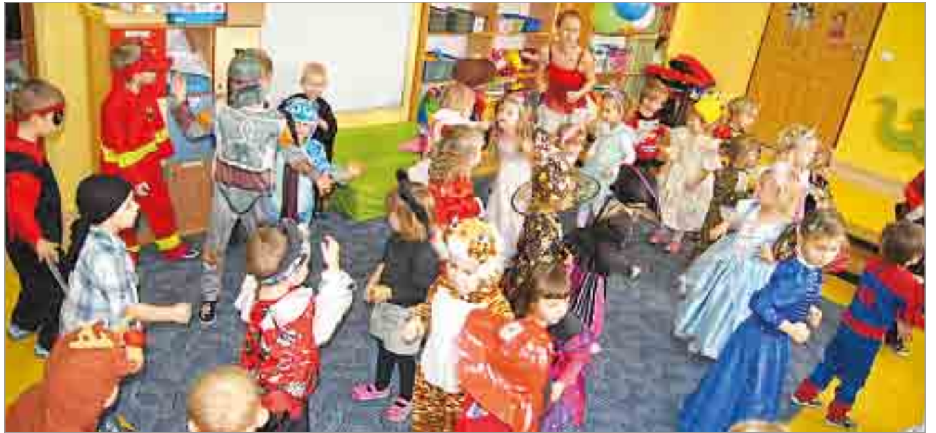
Bal karnawałowy w przedszkolu w Siemianicach.