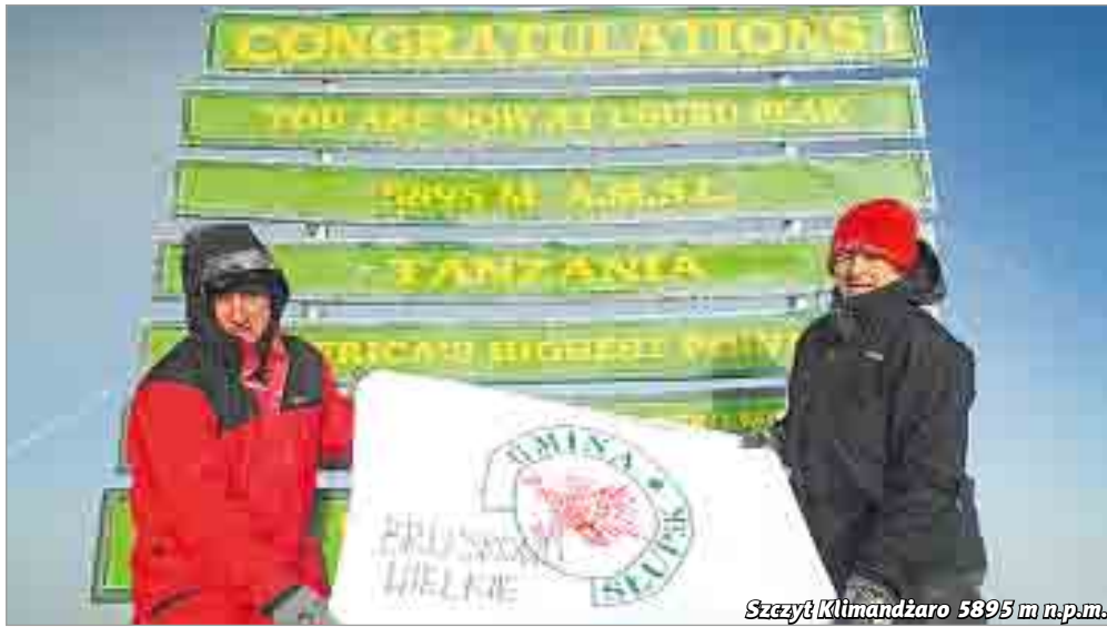
Szczył Kilimandżaro 5895 m n.p.m.

„Za dwadzieścia lat bardziej będziesz żałował tego, czego nie zrobiłeś, niż tego, co zrobiłeś. Więc odwiąż liny, opuść bezpieczną przystań. Złap w żagle pomyślne wiatry. Podróżuj, śnij, odkrywaj”. Mark Twain