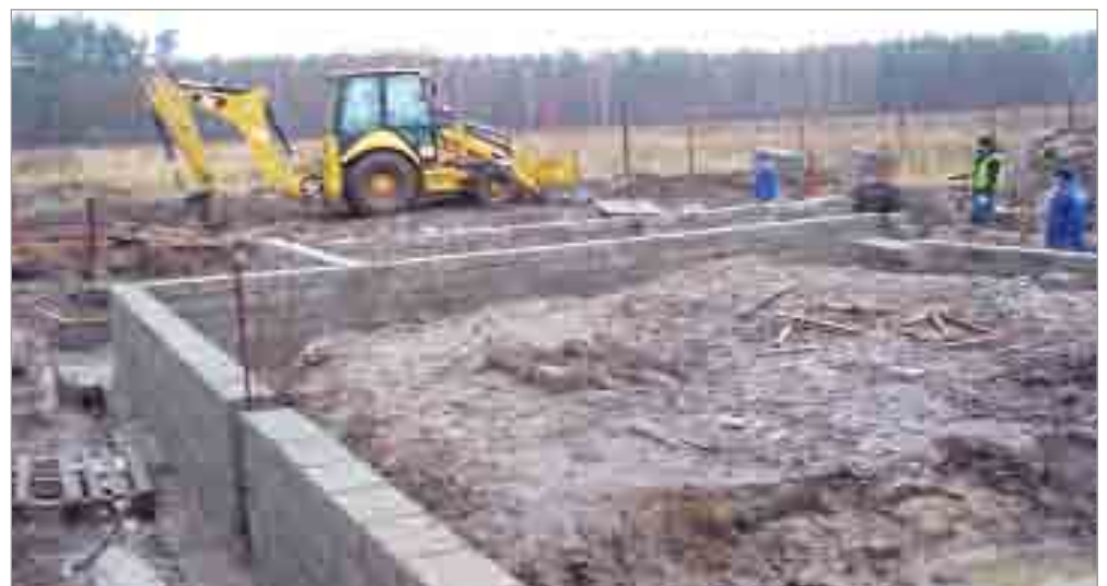
Prace budowlane w Lubuczewie.

nawiązywać będzie do tradycyjnej zabudowy wiejskiej. Całkowita powierzchnia nowo budowanej świetlicy to prawie 220 m 2 . Koszt realizacji inwestycji to prawie 1 150 000 zł. Planowany termin zakończenia prac to 31.08.2012 roku. Inwestycja wsparta zostanie środkami unijnymi „Wzmocnienie konkurencyjności i utrzymanie atrakcyjności obszarów zależnych od rybactwa”.