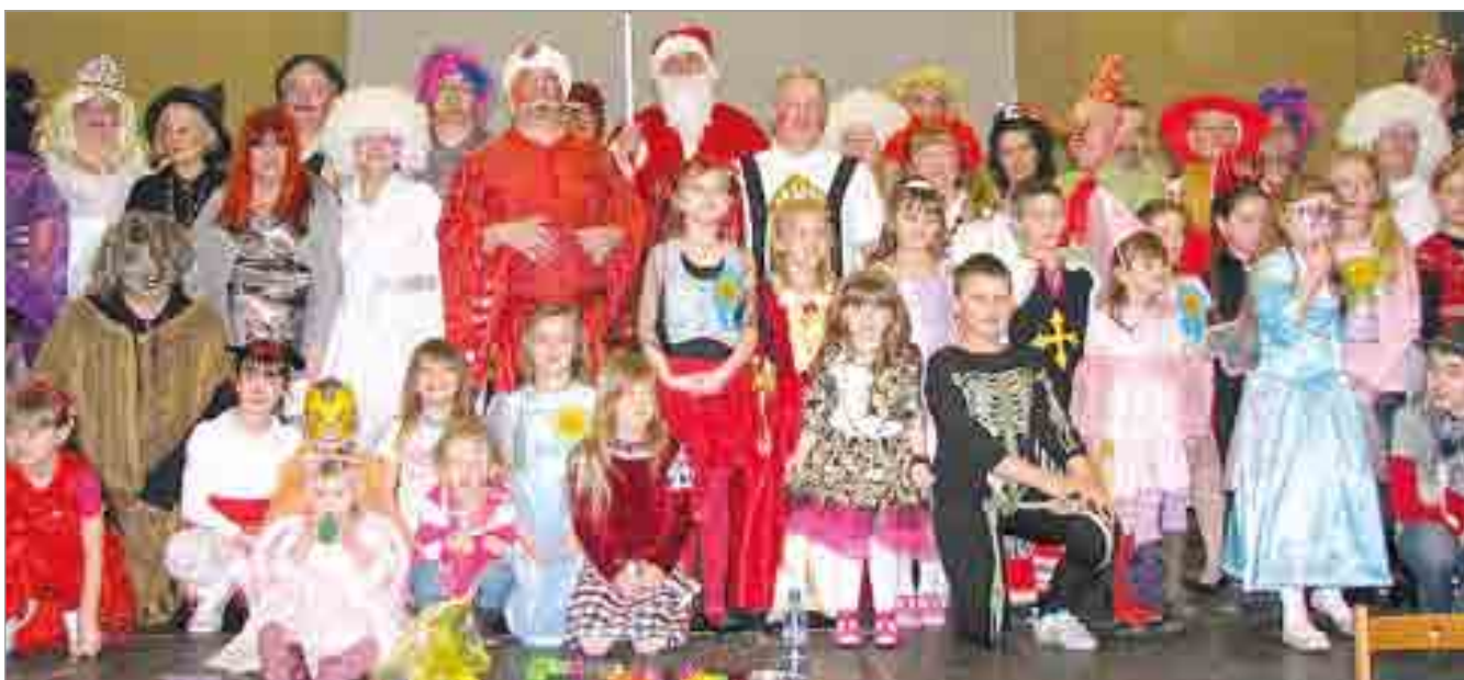
Aktorzy występujący w przedstawieniu.

gającą publicznością, jaką są dzieci. Nad reżyserią przedstawienia czuwała Hajka Święch z GOK-u. Niektórych zjadały nerwy, jednak wszyscy zgodnie przyznali, że kiedy tylko weszli na scenę i zobaczyli tłumy najmłodszych, którzy z radością podskakiwali do muzyki, cała trema zniknęła. Bohaterami przedstawienia były między innymi moliki książkowe, trolle, elfy, Czerwony Kapturek, rycerz, Kopciuszek, Pionokio, Baba Jaga, śnieżynki, chochliki, Królowa Śniegu, Jaś i Małgosia, dobra wróżka, Święty Mikołaj. Jak to w bajkach bywa niemożliwe stało się prawdą. Królowa Śniegu spotkała Pinokia, a Szeherazada ugościła Jasia i Małgosię, króle-