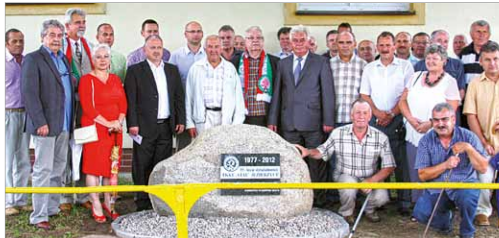
35-lecie Stowarzyszenia TKKF „Stal Jezierzycy”.