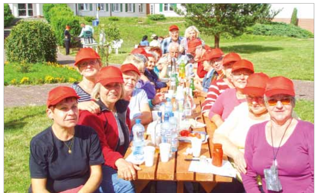
Aktywni seniorzy z Gminy Słupsk.

gdzie odbyła się biesiada przy grillu. Dzięki uprzejmości Dyrekcji DPS Seniorzy mieli możliwość zapoznać się z warunkami pobytu w ośrodku. Doskonała pogoda, która towarzyszyła podczas wyjazdu wprawiła wszystkich w dobry humor oraz pozytywnie nastroiła na kolejne spotkania.