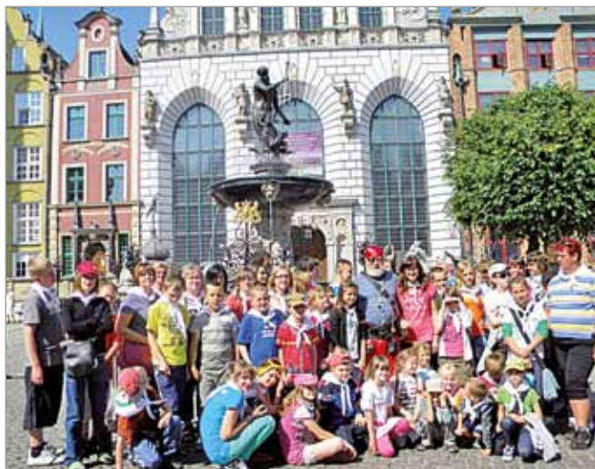
Wycieczka do Gdańska.

Również dzieci ze świetlic w Krępie i Kusowie wzięły udział w ciekawej wycieczce edukacyjnej w ramach projektu „Tam gdzie myszy Króla Popiela zjadły”. Trasa wycieczki obejmowała zwiedzanie: Biskupina, Gniezna,