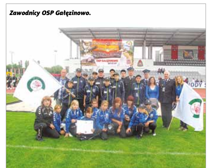
Zawodnicy OSP Gałęzinowo.