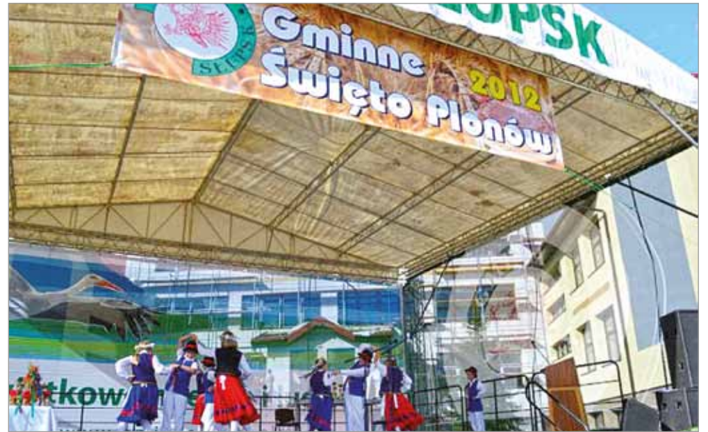
Występy artystyczne podczas Gminnego Święta Plonów.