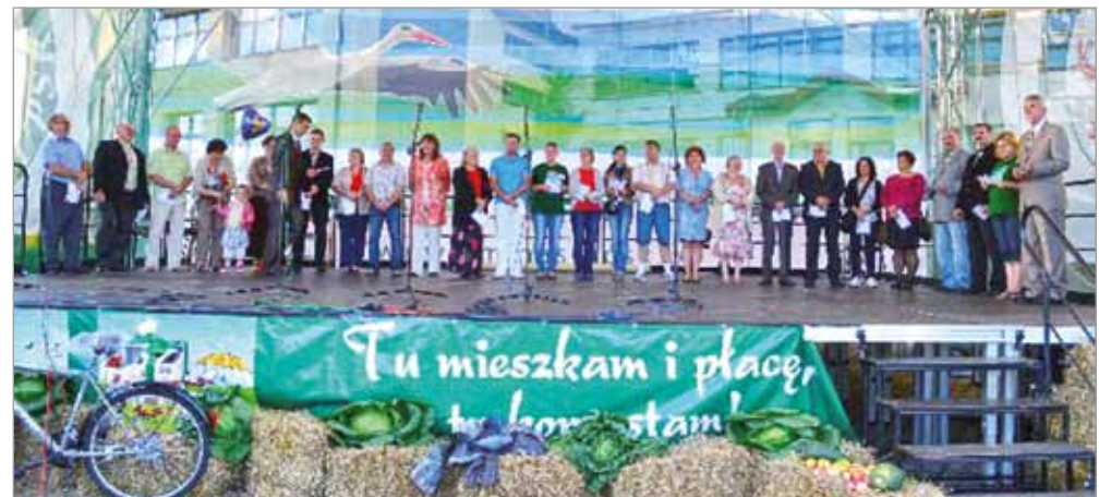
Wspólne zdjęcie sołectw Gminy Słupsk.