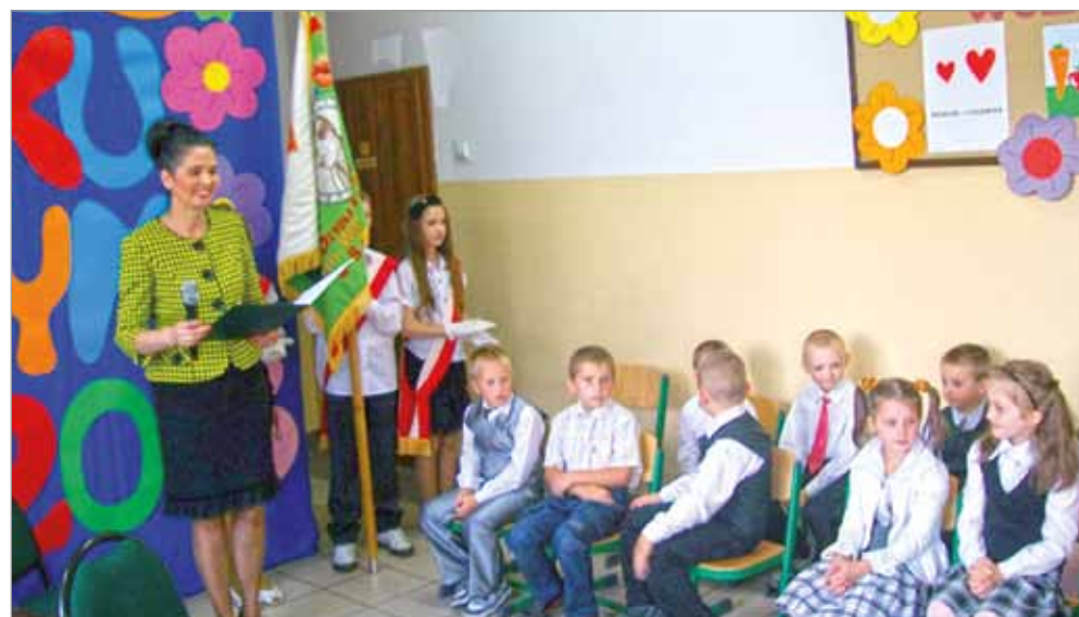
Szkoła Podstawowa w Bierkowie.

w szkołach podstawowych – 946 uczniów, w klasach „0” – 173 uczniów, w gimnazjach – 454, natomiast punkty przedszkolne i przedszkola przyjęły 259 podopiecznych. Wszystkim uczniom i nauczycielom w nowym roku szkolnym życzymy wszelkiej pomyślności.