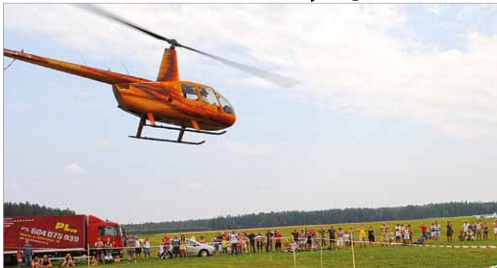
Piknik lotniczy w Krępie Słupskiej.

W sobotę 28 lipca na lotnisku Aeroklubu Słupskiego w Krępie Słupskiej odbyło się wielkie lotnicze wydarzenie – Piknik Lotniczy Sea and Sky.