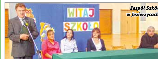
Zespół Szkół w Jezierzycach.

3 września rozpoczął się kolejny rok szkolny. Zapowiada się on bardzo pracowicie i atrakcyjnie. Powitano piętnastu nowych uczniów ze szkoły we Wrześcju, którzy od tego roku będą uczęszczać do pierwszej klasy tutejszego gimnazjum.