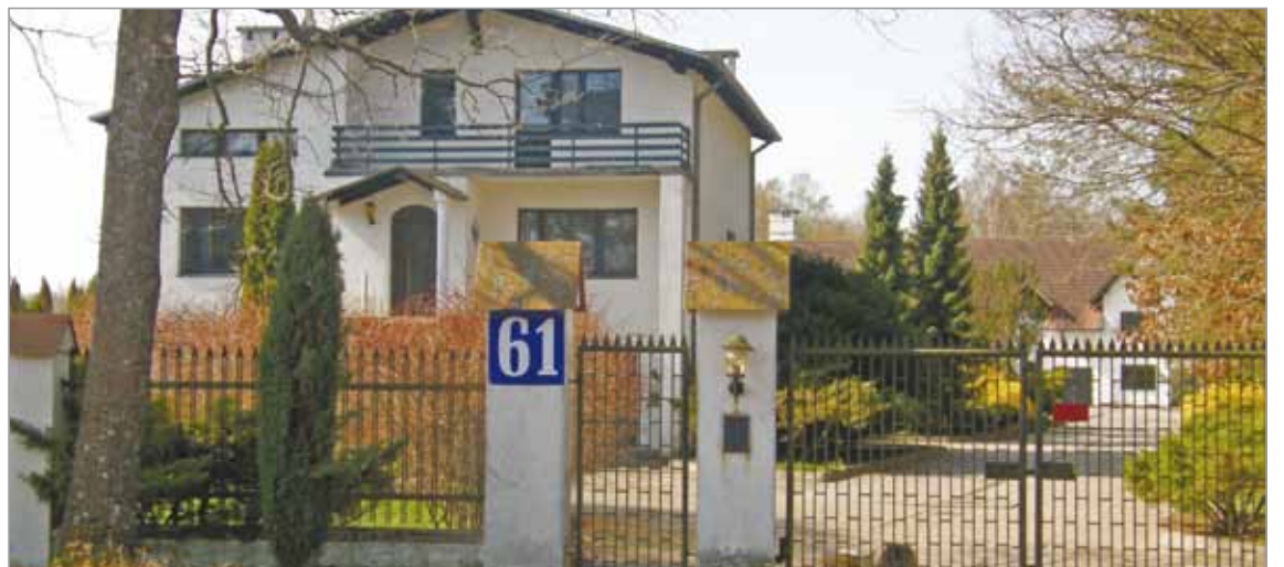
Nieruchomość w Głobinie - na sprzedaż.

Ceny działek sprzedawanych w Gminie Słupsk wahają się już od 18 zł netto za metr kwadratowy. Zakup nieruchomości w Gminie Słupsk to korzystny wybór, dobrze się tu żyje, wypoczywa, pracuje i prowadzi biznes.