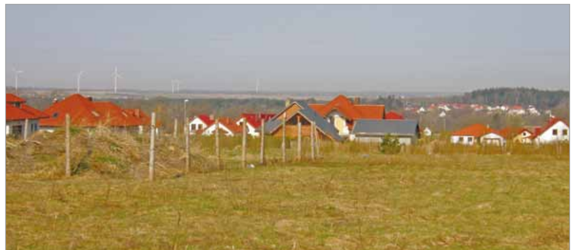
Osiedle „Kwitnące Ogrody” w Krępie Słupskiej.