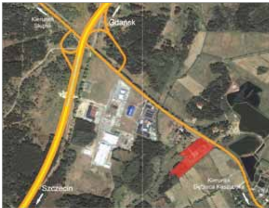
Prezentujemy atrakcyjną nieruchomość w Głobinie.

Gmina Słupsk jest miejscem przyjaznym dla Inwestorów. Nasi kompetentni pracownicy udzielą Państwu kompletnej i rzetelnej informacji na temat wszystkich terenów inwestycyjnych jakimi dysponuje Gmina Słupsk.