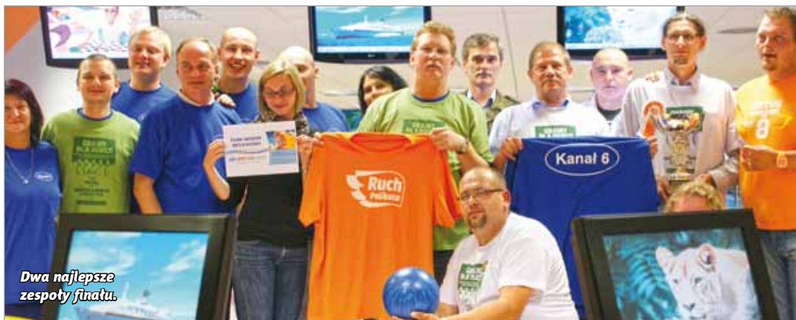
Dwa najlepsze zespoły finału.