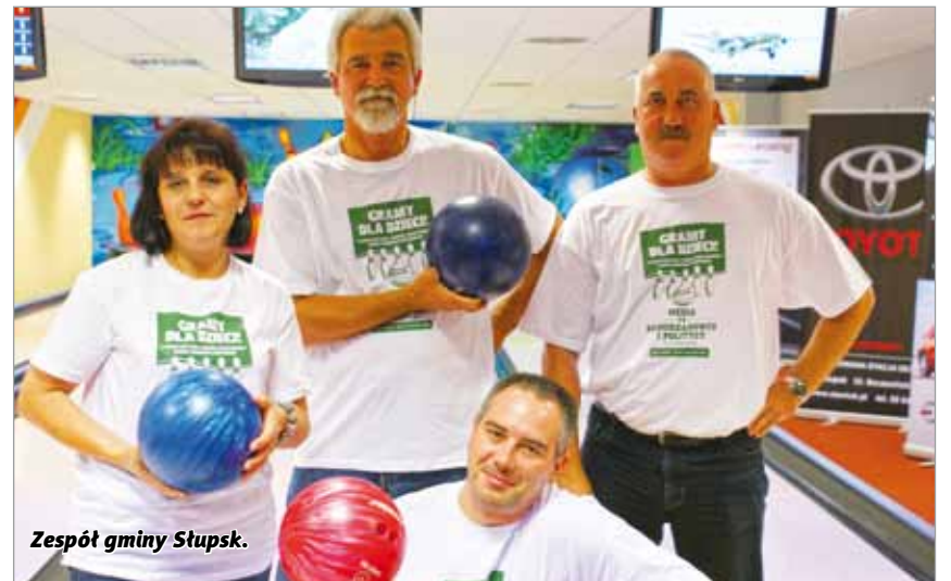
Zespół gminy Słupsk.

Za wspólną zabawę i sportową postawę dziękujemy wszystkim drużynom i zawodnikom, którzy walczyli o nagrodę dla dzieci. Dziękujemy też naszemu partnerowi - Bankowi BZ WBK, który zawsze chętnie włącza się w nasze akcje. Kolejny turniej za rok, zapraszamy.