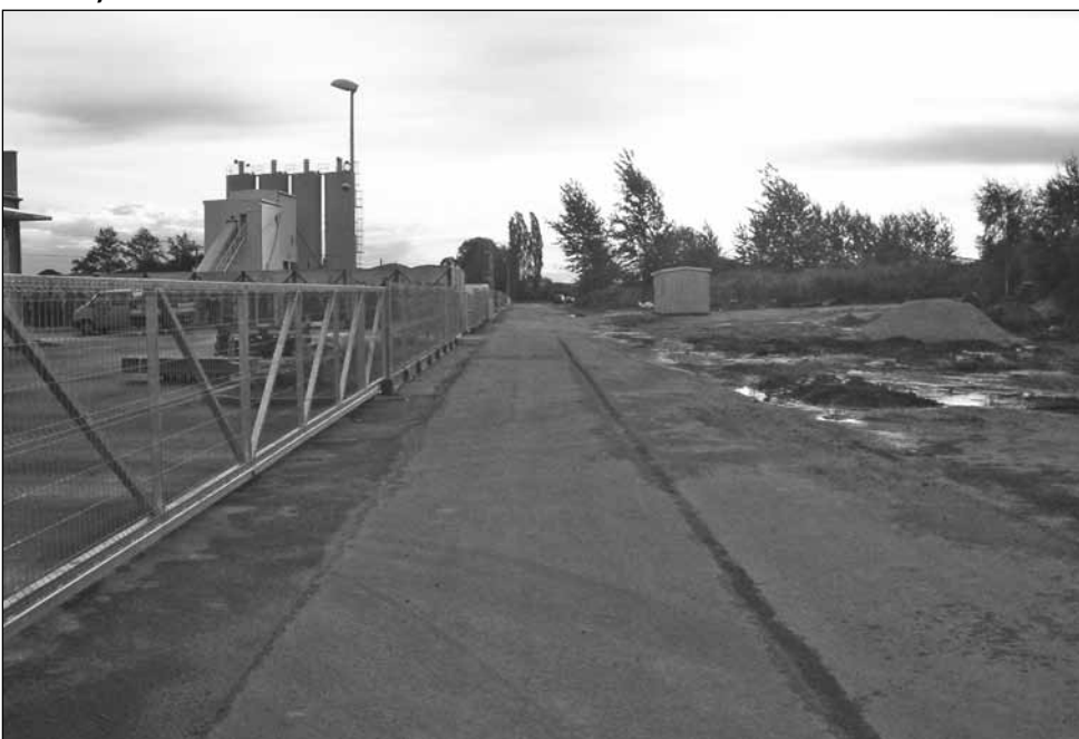
Remont ul. Miedzianej we Włynkówku Droga przebudowana została na odcinku 591 mb i szerokości 5m. Przebudowa drogi polegała na wyprofilowaniu drogi z płyt drogowych i ułożeniu na niej mieszanki mineralno – asfaltowej oraz wykonaniu obustronnych poboczy. Przebudowę ulicy Miedzianej współfinansowała Pomorska Agencja Rozwoju Regionalnej S.A. Koszt inwestycji to 481.528,42 zł brutto.