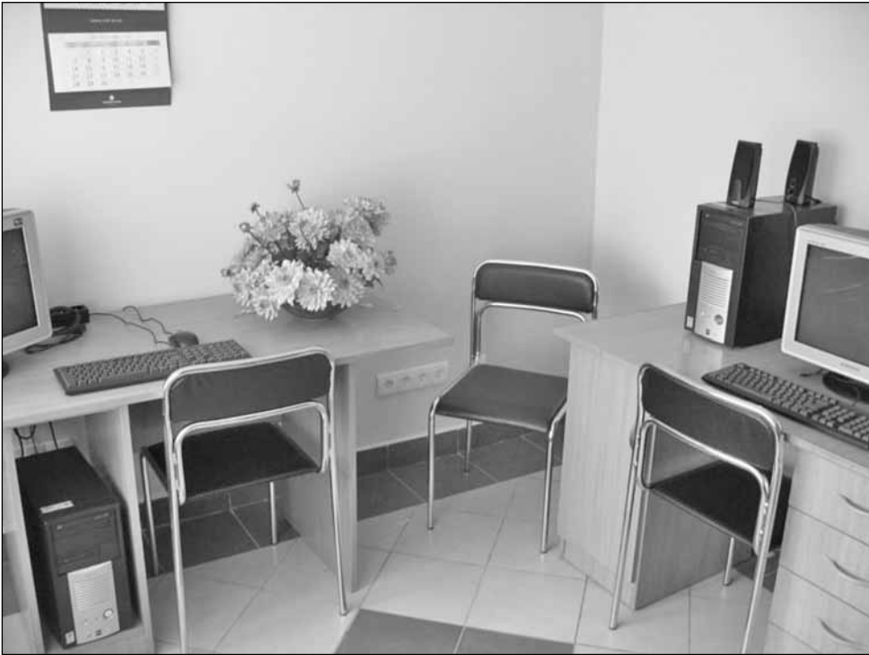
Świetlica wiejska w Bruszkowie Małym. Wykonano generalny remont pomieszczeń świetlicy. W świetlicy znajdują się: sala świetlicy, sala komputerowa, toalety, korytarz, szatnia, kotłownia i kuchnia. Budynek świetlicy zyskał docieplenie oraz nową elewację. Koszt remontu wyniósł 376.481,90 zł brutto.