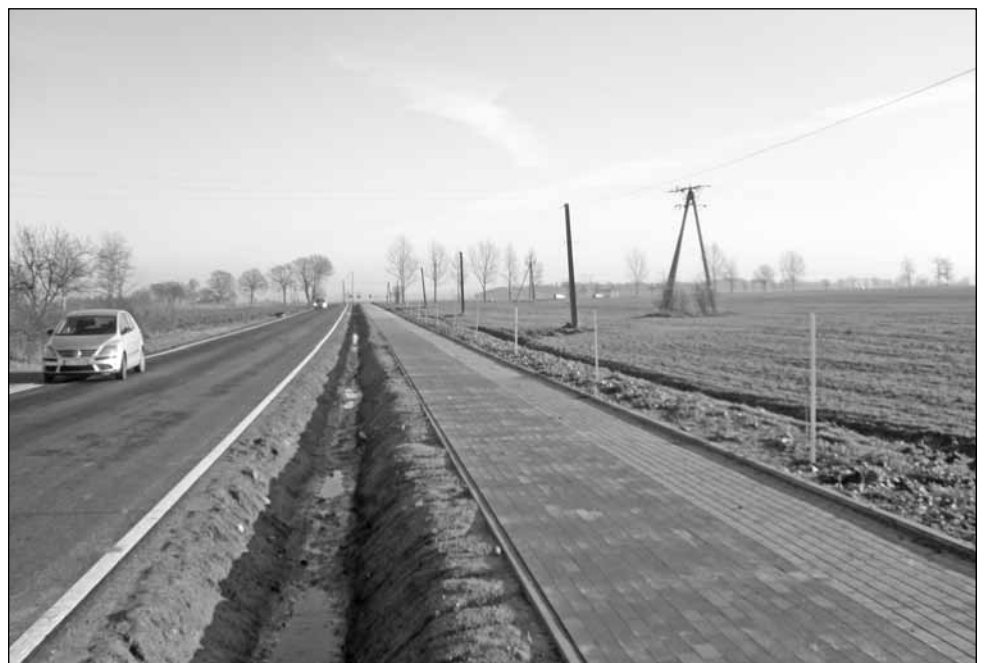
Przebudowa drogi Strzelinko – Włynkowo Przebudowa drogi gminnej Strzelinko-Włynkowo wraz z budową ciągu pieszo-rowerowego zwiększyła dostępność otoczenia drogi do regionalnego i krajowego układu drogowego i przyczyniła się do poprawy jakości lokalnej infrastruktury drogowej. Inwestycja ta jest dofinansowana w ramach Narodowego Programu Przebudowy Dróg Lokalnych 2008-2011, na kwotę 1 682 000 zł.