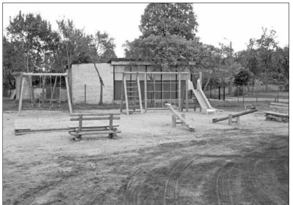
Plac zabaw w Gać W miejscowości tej powstał plac zabaw dla dzieci. W jego skład weszły następujące urządzenia: piaskownica drewniana, dwie ławki drewniane, dwie huśtawki wagowe (ważki), zestaw zabawowy z huśtawką. Koszt inwestycji wyniósł 12.500 złotych brutto.