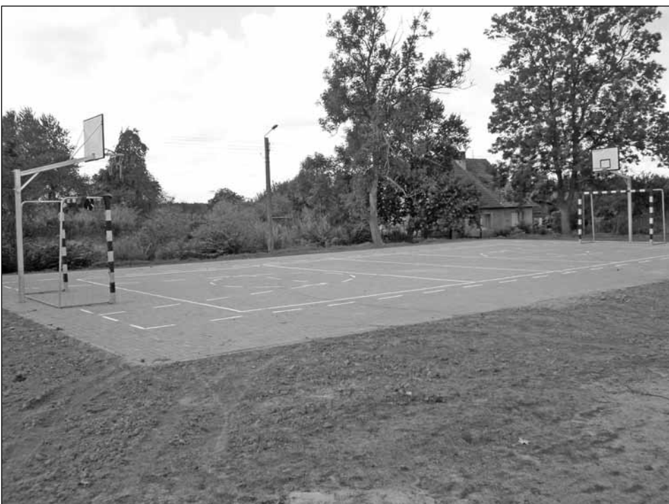
Boisko wielofunkcyjne w Gać Boisko ma wymiary 24m x 15m o nawierzchni z kostki. Wyposażone jest w dwie bramki do gry w piłkę ręczną, dwa słupki do gry w siatkówkę z siatką oraz dwa nieregulowane słupy z obręczami do gry w koszykówkę. Koszt inwestycji wyniósł 48.000,00 zł brutto.