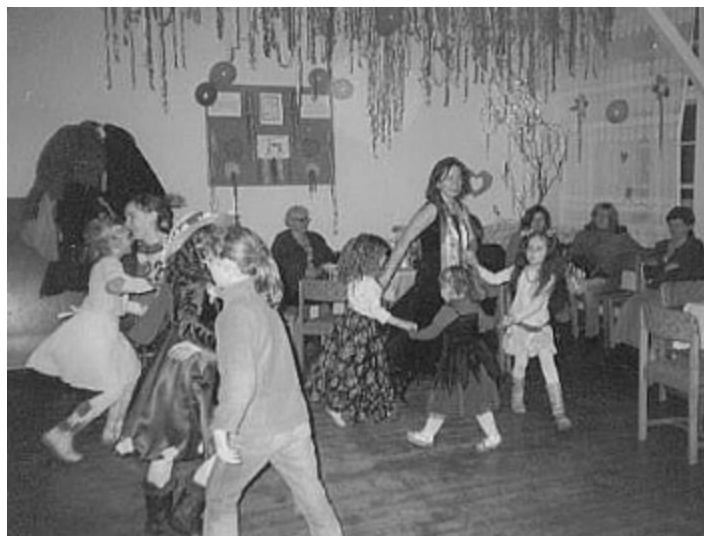
Wesoła zabawa najmłodszych...

Jasełka poł czone z choink mo na było zobaczy i usłysze dnia 28 stycznia. W pierwszej kolejno ci dzieci i młodzie przedstawiły jasełka przygotowane przez panie Władysław Szewc i Bo en Białow s. Przedstawienie zostało nagrodzone bardzo gor cymi oklaskami. Nast pnie rozpocz ła si zabawa choinkowa. O godz. 19 wkroczył wi ty Mikołaj rozdaj c dzieciom paczki, które w tym roku z powodu braku sponsorów były bardzo skromne. Mimo wszystko dzieci były bardzo zadowolone. Były równie konkursy, pocz stunek i wspólna zabawa.