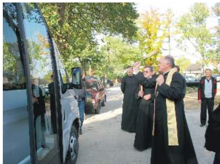
Po wi cenie nowego gminnego autobusu