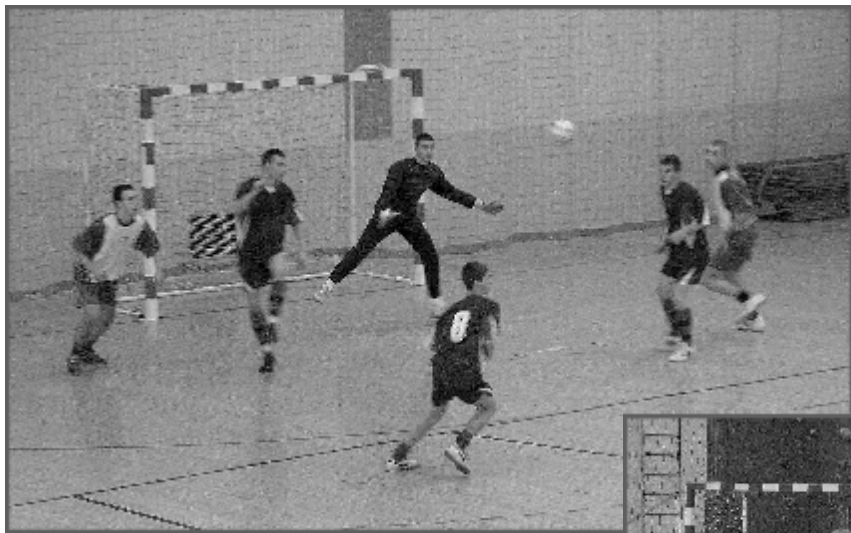
Przeżyjmy to jeszcze raz...

W przerwie między meczami wszyscy zawodnicy i trenerzy oraz sędziowie mieli zapewniony gorący posiłek. Mecze przebiegały tę spokojniej niż w ubiegłym roku, gdzie sędziowie pokazali jedną czerwoną i dwie żółte kartki. Tym razem obyło się bez kartek, choć niektóre decyzje sędziów budziły sprzeciw zawodników i kibiców. Co bardziej krewkich zawodników trenerzy musieli mitygować, bo byli gotowi wdawać się w dyskusje na parkiecie. Rozgrywki zorganizował Gminny Ośrodek Kultury w Głobinie.