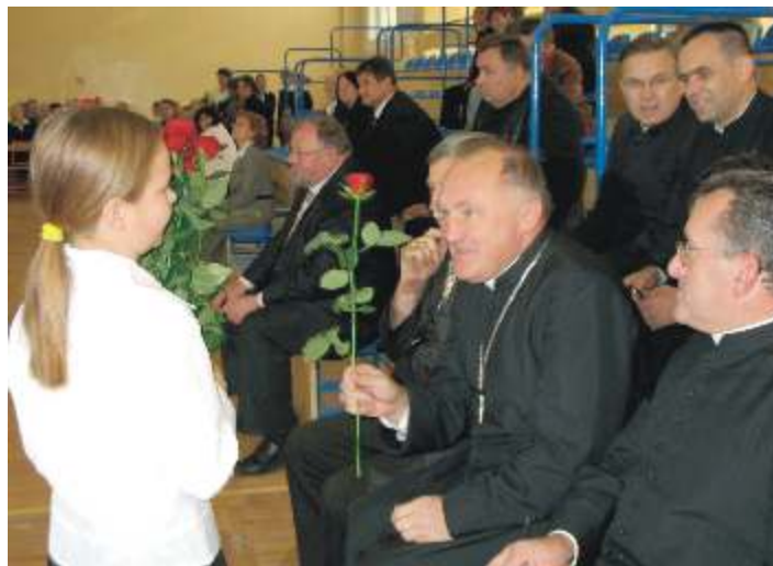
Ró a od społeczno ci szkolnej

Ten charakterystyczny gest zało enia ramion podczas skupienia i zadumy zna ju cała Polska