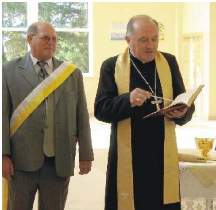
Po wi cenie nowej wietlicy wiejskiej