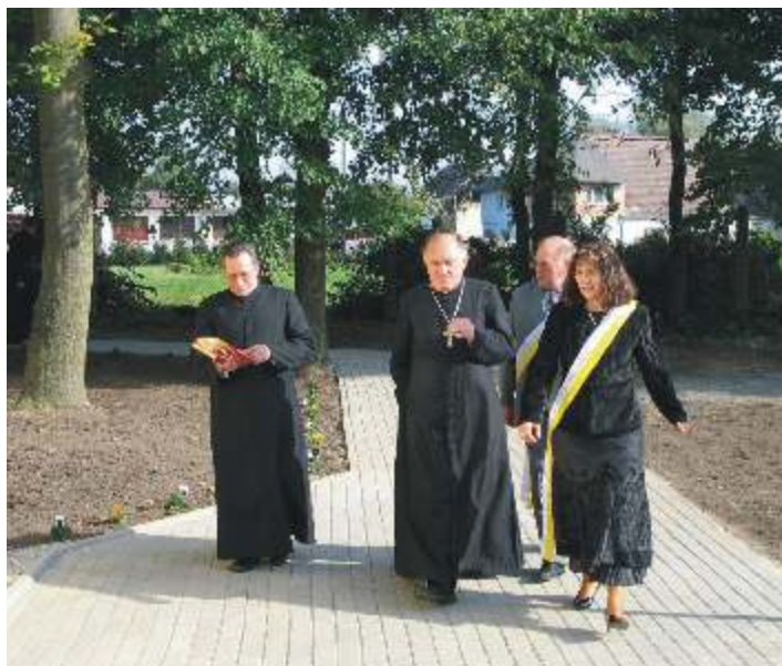
Z rodzicami chrzestnymi wietlicy