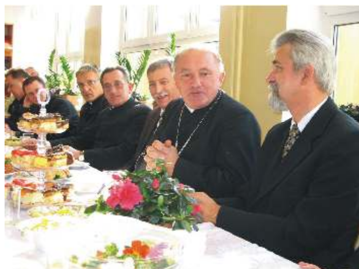
Wspólny posiłek w szkolnej stołówce. Ksi dz biskup Kazimierz Nycz kazał wszystkim zosta tak długo, a jedzenie zniknie z talerzy