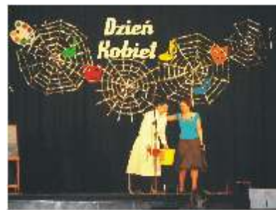
M czyzna w oczach kobiet - - przedstawienie w wykonaniu młodzie y z Klubu Garnizonowego

Spotkanie zorganizował Zarz d Koła Nr 4 Byłych ołnierzy Zawodowych i Oficerów Rezerwy Wojska Polskiego, Zarz d Pomorskiego Stowarzyszenia Pilotów Wojskowych w Słupsku i Zarz d Stowarzyszenia Przyjaciół 28. Pułku Lotnictwa My liwskiego.