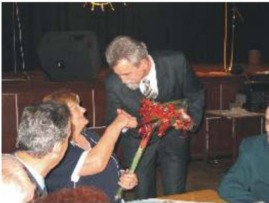
Kwiaty dla pa od wójta i pilotów

Marzec wyznacza jedna charakterystyczna data: 8 dzie tego miesi ca. Wówczas wszyscy staraj si uhonorowa panie. Tak było i w tym roku w Redzikowie.