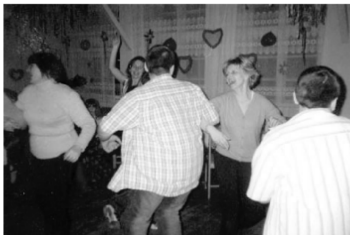
...i ta ce dla troch starszych