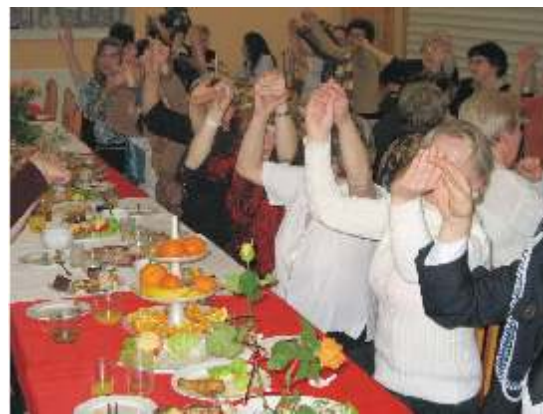
Dobra zabawa trwała przy stolikach...