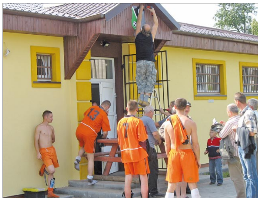
Klub Sportowy „Dąb” Kusowo ma już nową szatnię.