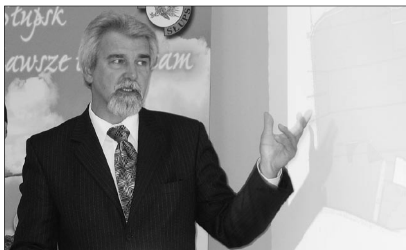
Wójt prezentuje plan zagospodarowania przestrzennego podczas debaty publicznej.