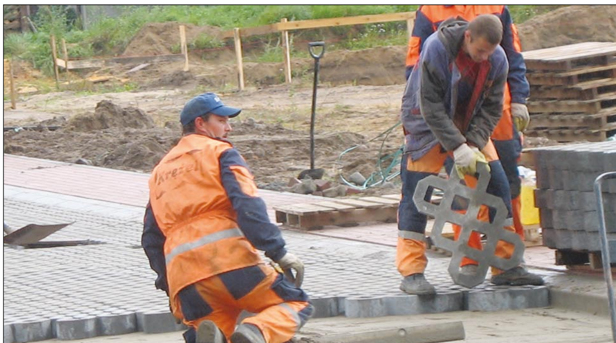
Przebudowę ulic: Cedrowej, Cisowej, Cyprysowej i Jodłowej współfinansują mieszkańcy.