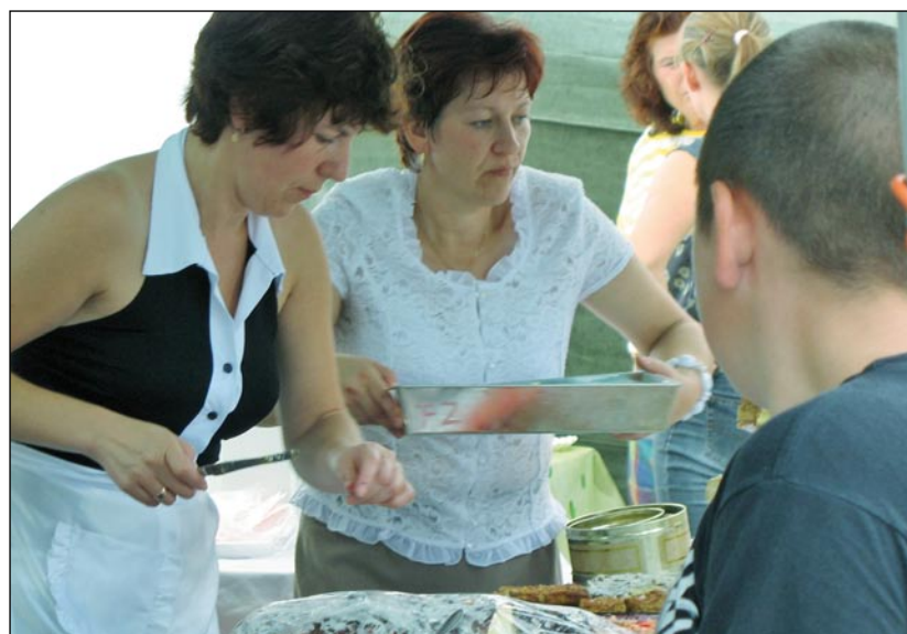
Festyn przygotowali mieszkańcy Swołowa, Krzemienicy i Gać.

Podczas dwudniowej zabawy na remont kościoła organizatorzy festynu zebrali 12 tysięcy 222 zł. – Cieszymy się, że z roku na rok