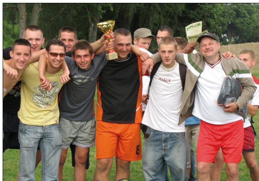
Zwycięska drużyna „Szansa” Siemianice.