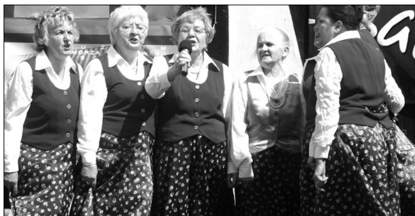
Gminę Słupsk reprezentował między innymi zespół Świtezianki.