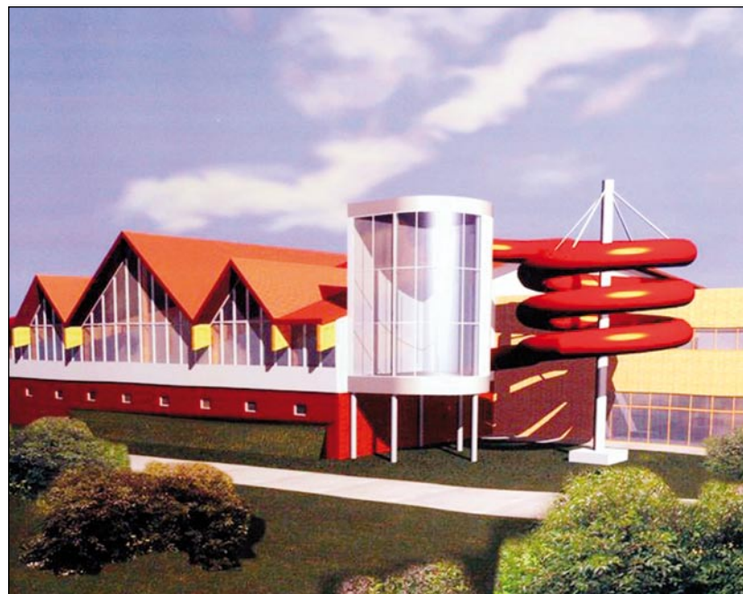
Projekt aquaparku w Redzikowie.

Budowa potrwa 18 miesięcy od dnia podpisania umowy.