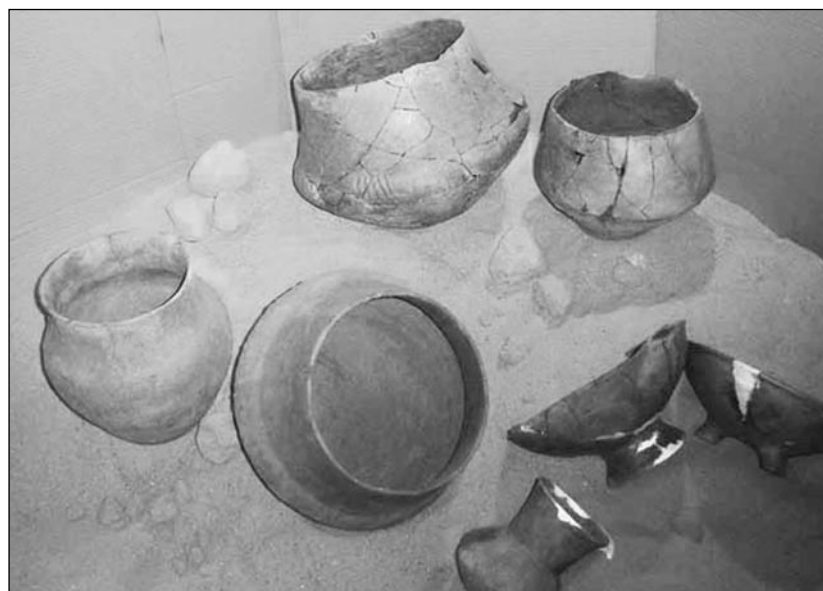
Wyroby, które powstały w kulturze łużyckiej.