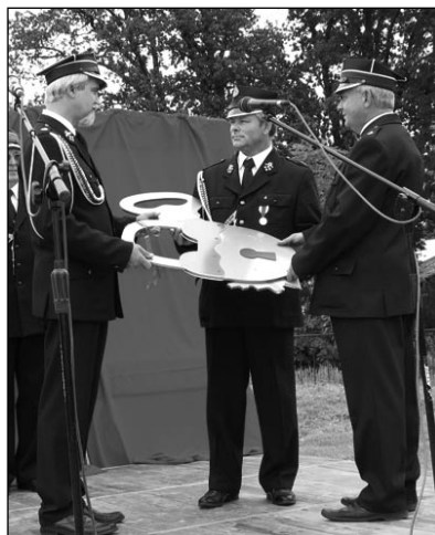
Przekazanie symbolicznych kluczy do nowej remizy.