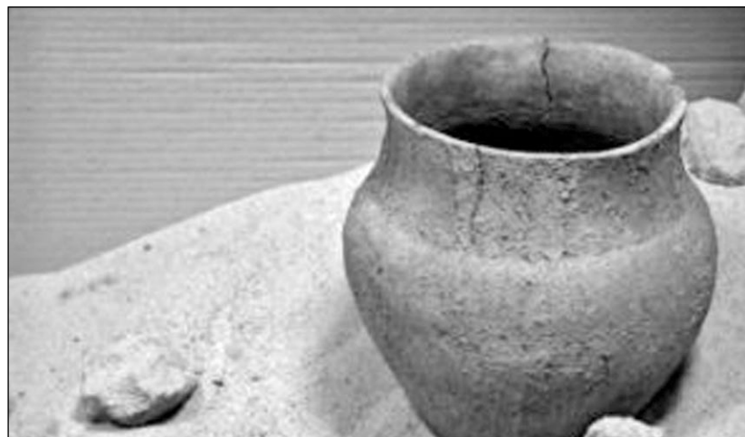
Popielnica używana przez pierwszych osadników Gałęzinowa