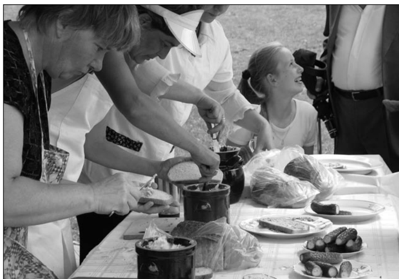
Koło Gospodyń Wiejskich w Bukówce przygotowało specjalny poczęstunek.