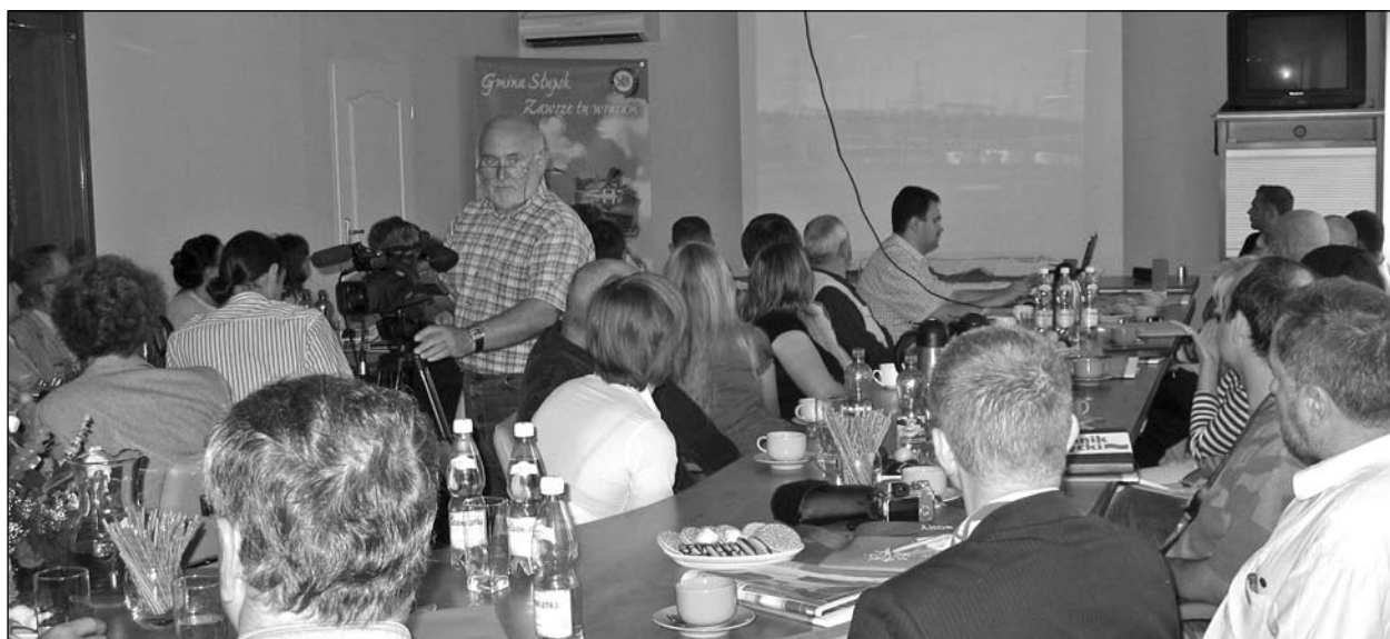
Zebrani goście obejrzeni film o gminie Słupsk.