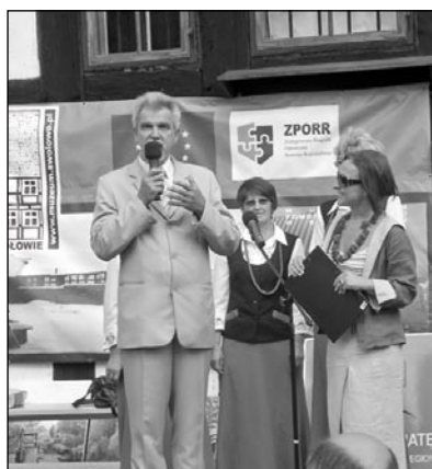
Wójt zachęcał do odwiedzania Swołowa.