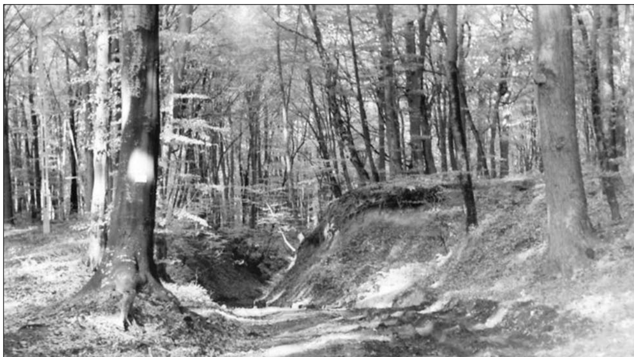
Droga przebiegająca przez Gałęzinowo i Żoruchowo, powstała 2,5 tysiąca lat temu i zachowała się do dziś.