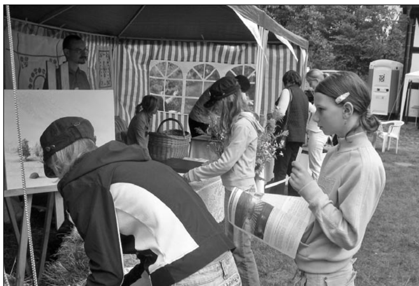
Goście na jarmarku zaangażowali się w konkurs.

Na scenie zaprezentowały się zespoły Gminnego Ośrodka Kultury w Głobinie. Przed publicznością wystąpiły „Bierkowiarki”, zespół taneczny „Bez nazwy”, „Dzwoneczki” z Siemianic oraz „Świtezianki”.