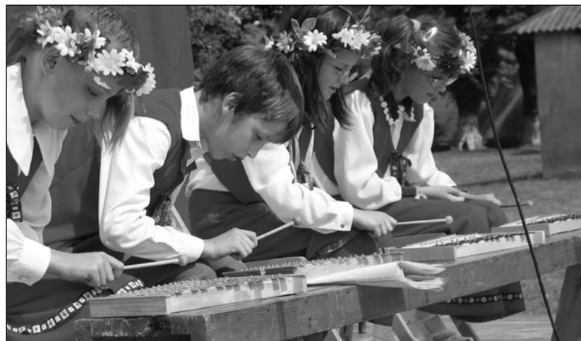
Zespół z Siemianic zagrał znane melodie ludowe.