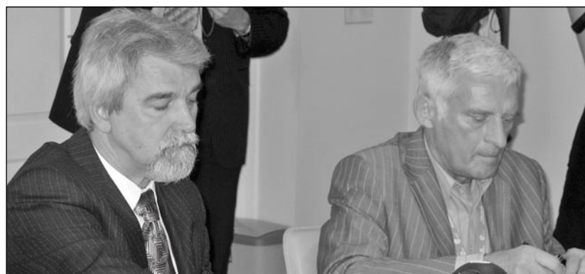
Były premier Jerzy Buzek podkreślał znaczenie wolontariatu.

Jerzy Buzek pochwalił również za działalność społeczną studentów. – Dzięki nim wiele osób, głównie młodzież zauważa, że warto coś zmienić w życiu na lepsze – powiedział były premier. – To nieprawda, że dzieci z małych miejscowości mają mniejsze szanse na rozwój. One po prostu nie mają dobrych wzorców. Dlatego bardzo ważne dla nich mogą być spotkania z wolontariuszami. Dzieci zobaczą, że ich życie może potoczyć się w dobrym kierunku, że jeśli zaczną się kształcić mogą coś w życiu osiągnąć.