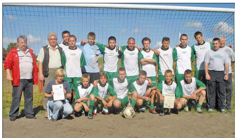
Zespół z Kusowa okazał się bezkonkurencyjny.