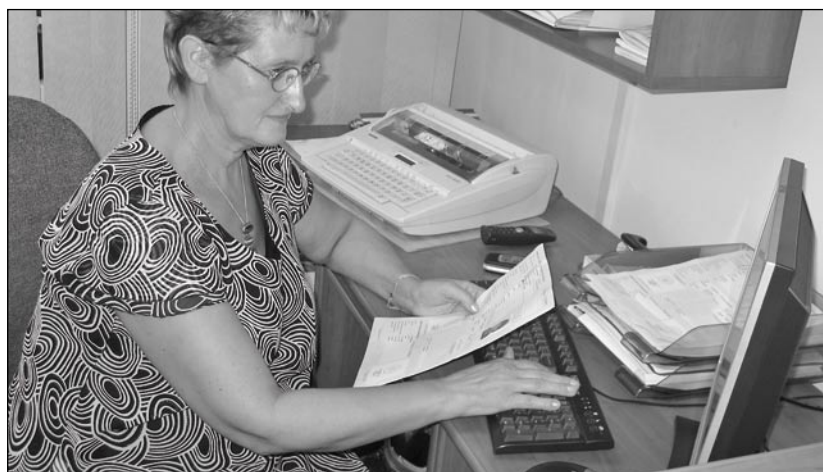
Na wymianę papierowych dowodów mamy coraz mniej czasu.

osobiście w Urzędzie Gminy przy ul. Sportowej 34 w pokoju nr 16. Do wniosku konieczne trzeba dołączyć: dwie aktualne fotografie z odsłoniętym lewym uchem, odpis skrócony aktu urodzenia lub odpis skrócony aktu małżeństwa, dotychczasowy dowód osobisty do wglądu oraz dowód uiszczenia opłaty – 30 złotych. Informacje uzyskać można pod numerem telefonu 842 84 60 wew. 31. – Jeśli chcemy uniknąć kolejek oraz wydłużenia czasu oczekiwania na dowód trzeba jak najszybciej złożyć wniosek – apeluje Barbara Wiła, inspektor ds. dowodów osobistych.