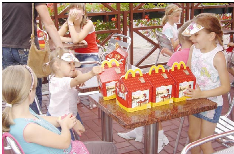
Jedną z atrakcji dla dzieci był wyjazd do restauracji McDonald's.

W zajęciach wzięło udział 20 dzieci w wieku od 4 do 15 lat. Ogromną atrakcją dla nich była wycieczka do Słupska, podczas której zwiedzali Zamek Książąt Pomorskich, Galerię Bursztynową oraz Basztę Czarownic. – Nasi podopieczni z niecierpliwością czekali na wizytę