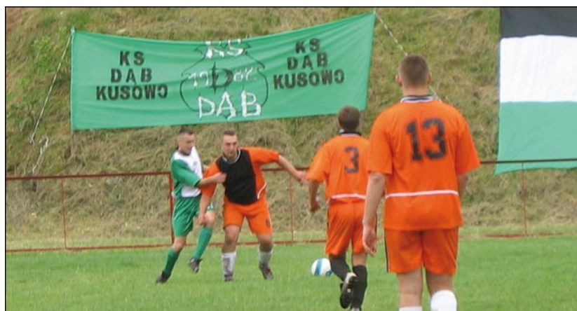
W turnieju wzięło udział pięć drużyn.