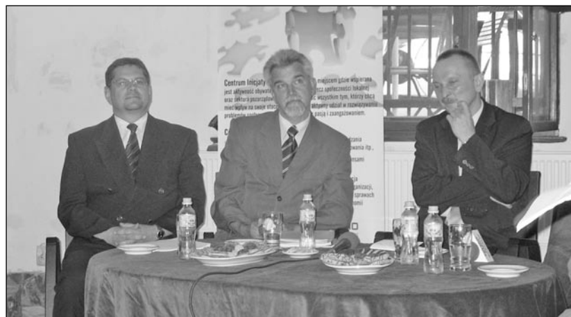
Mieszkańcy Redzikowa pytali samorządowców o plany lotniska i tarczy antyrakietowej.